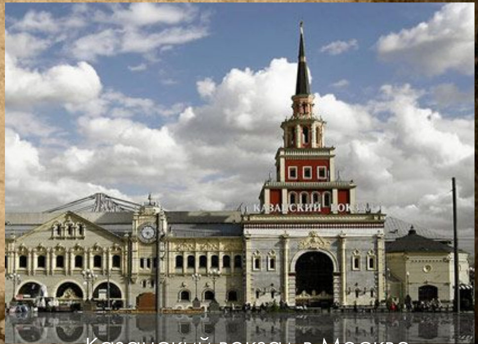
Казанский вокзал в Москве