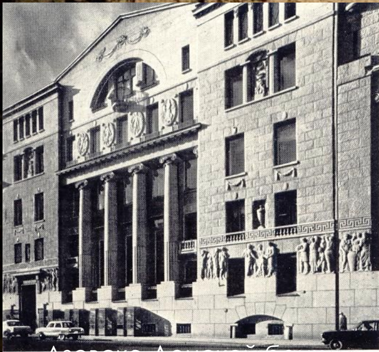
Азовско-Донской банк в Петербурге

Русская архитектура в начале XX века переживает последний период своего расцвета, связанный с появлением стиля модерн . Его создатели стремились максимально учесть те возможности, которые представляют новые строительные конструкции и материалы (бетон, сталь, стекло), и в то же время эстетически осмыслить их, придать им художественную выразительность.