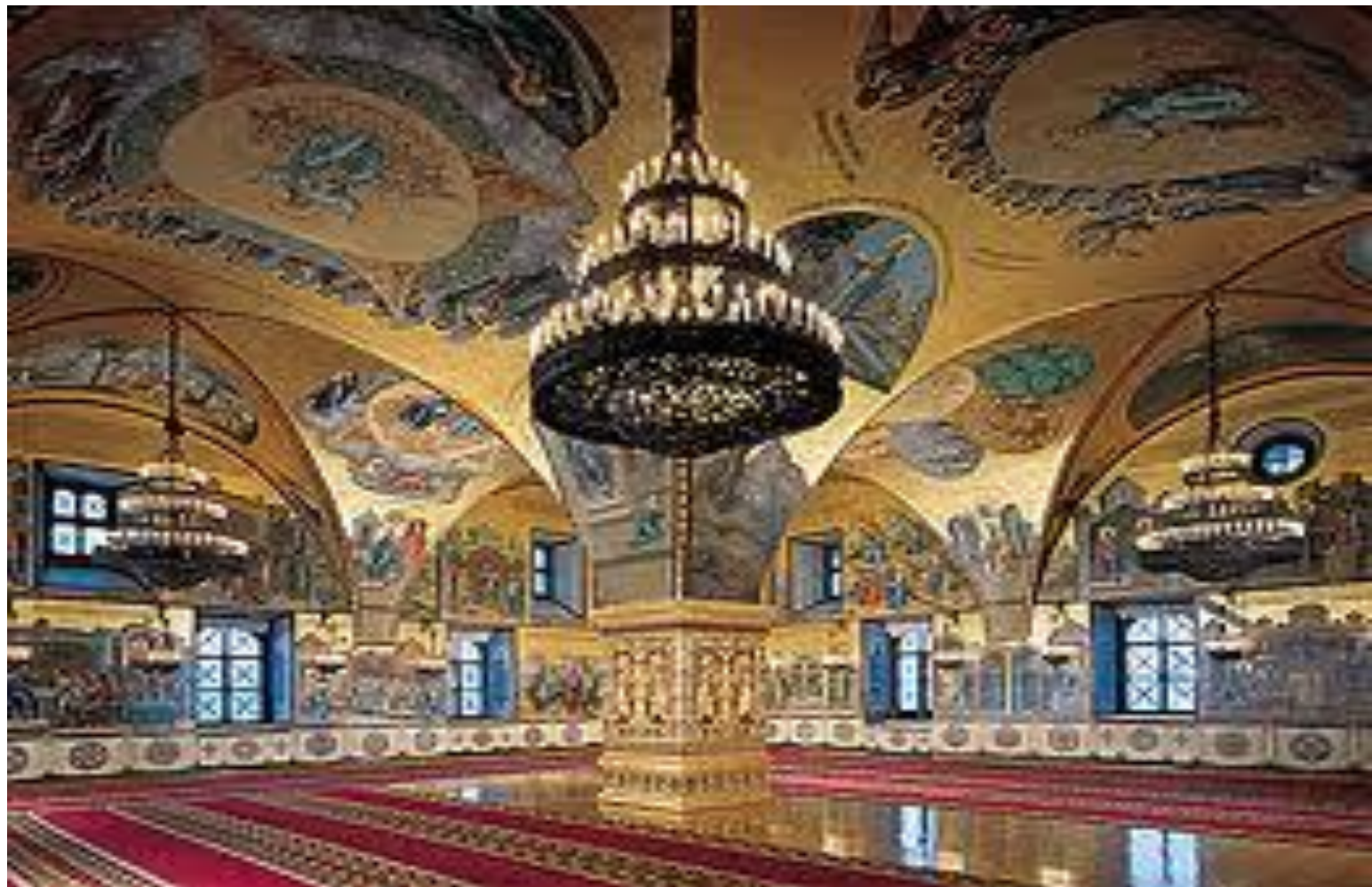
Грановитая палата. 1487 – 1491 года