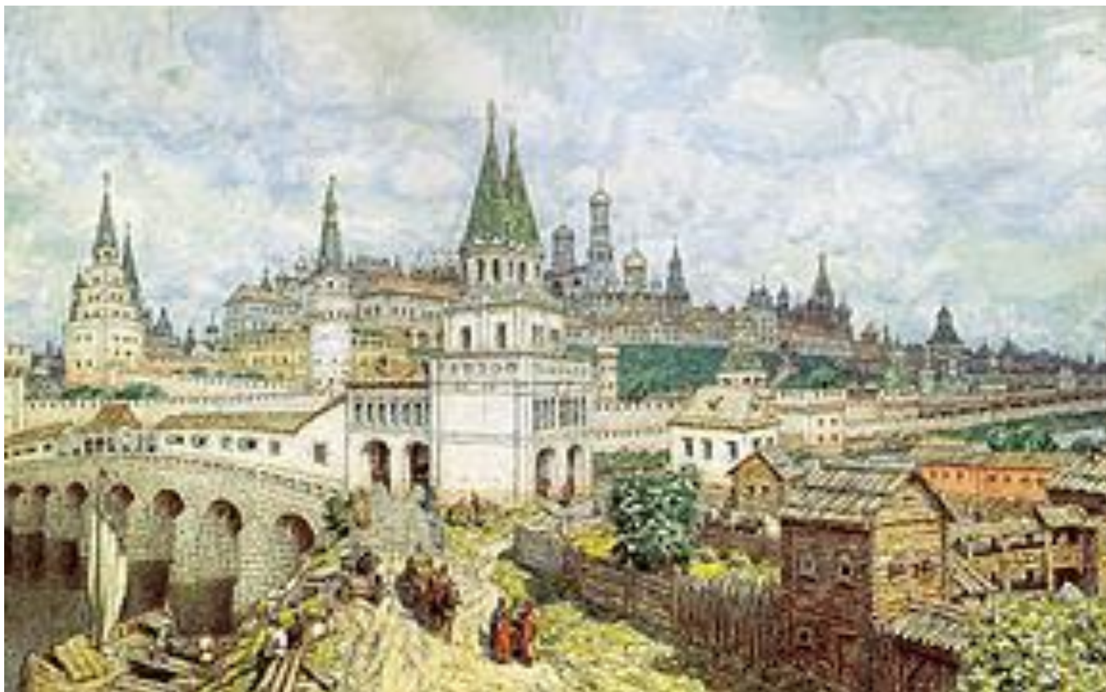
Московский Кремль в XVI веке. «Москва белокаменная»