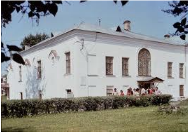
Грановитая палата в Новгороде