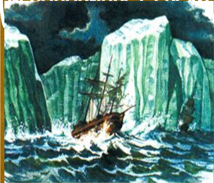
Шлюпы "Восток" и "Мирный" у берегов Антарктиды