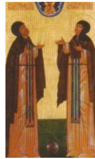
Пётр и Феврония Муромские