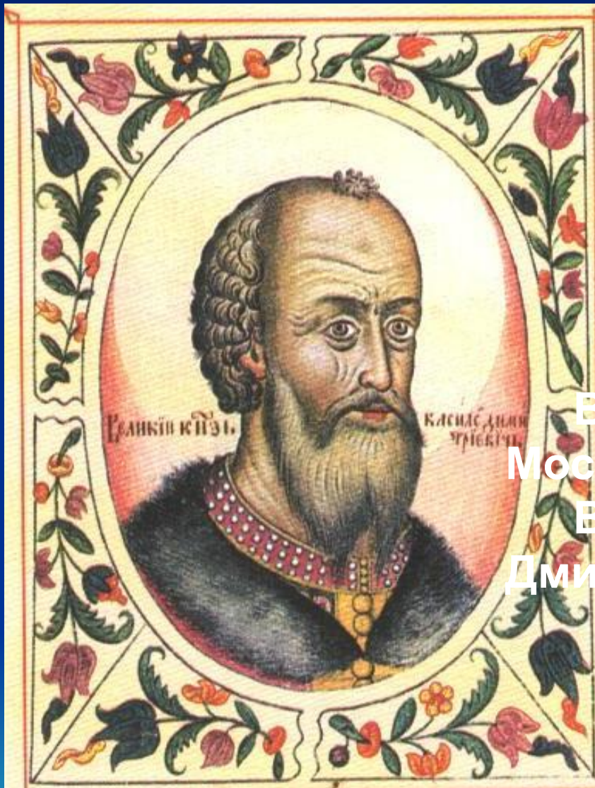
Великий князь Московский Василий Дмитриевич