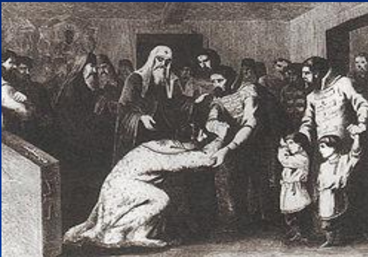
В.В.Муижель. Примирение Василия II с Шемякой.