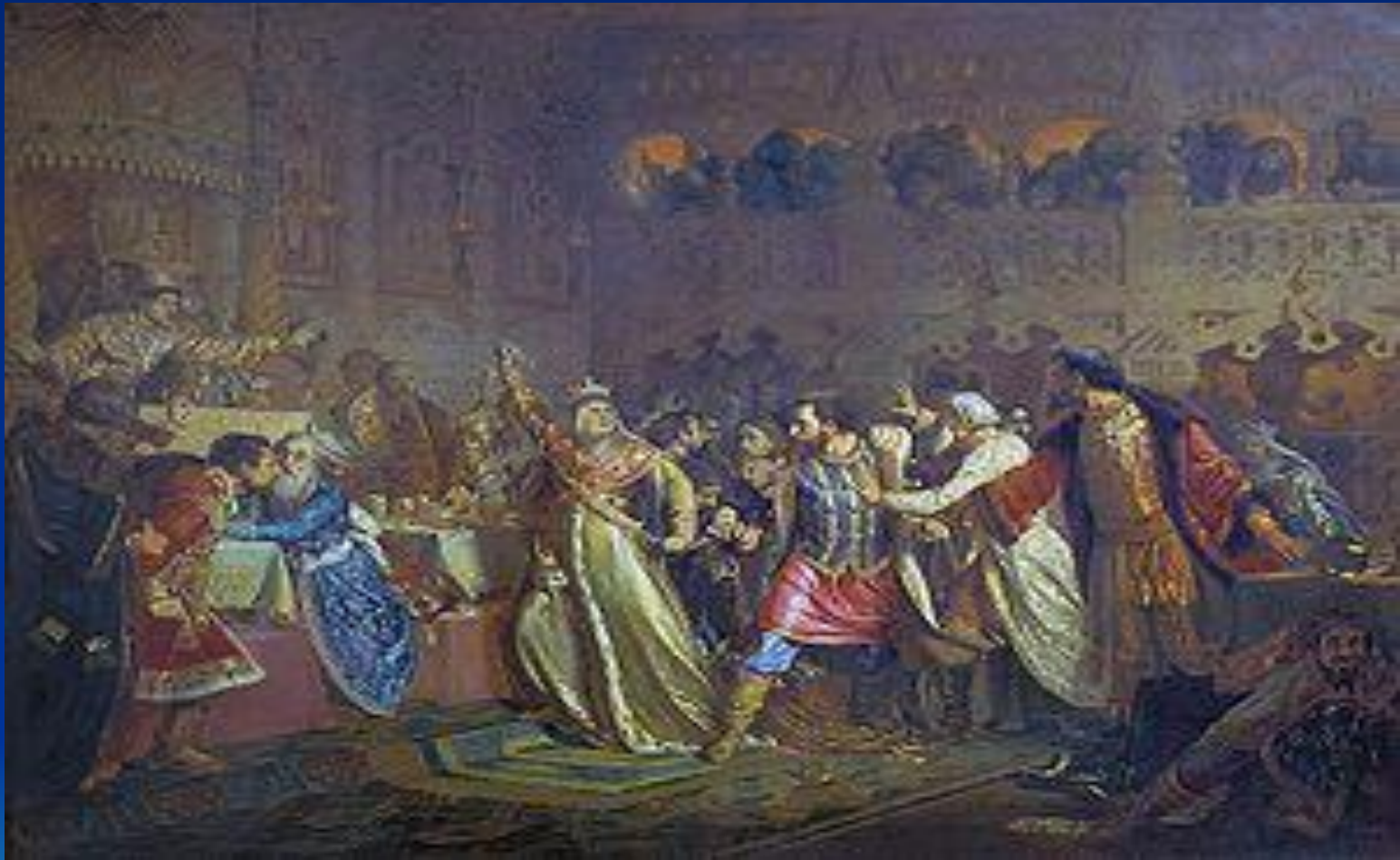
Софья Витовтовна срывает золотой пояс с Василия Дмитриевича.