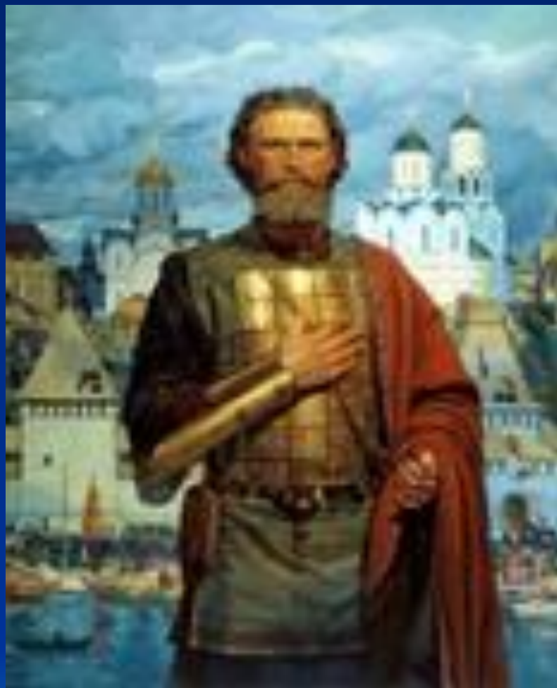
Дмитрий Иванович Донской