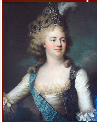
София Доротея Вюртембергская (Мария Фёдоровна) (1759-1828)