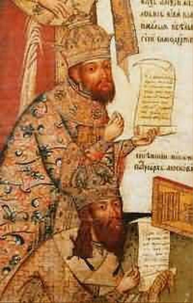
«Патриарх Никон и Алексей Михайлович»

Годы патриаршества Никона были временем искренней и тесной дружбы царя и патриарха. Первые годы патриарх Никон и царь Алексей Михайлович сообща решали все важнейшие дела как церковной, так и государственной жизни. Царь непременно участвовал во всех Соборах Церкви, а Патриарх – в Боярской думе. В 1654 году, отправляясь в поход на войну с Польшей, царь оставляет вместо себя Патриарха Никона, а, вернувшись с войны, царь жалует Патриарха титулом «великий государь». Тем не менее, между Патриархом и Алексеем Михайловичем существовало очень чёткое разделение ответственностей и обязанностей.