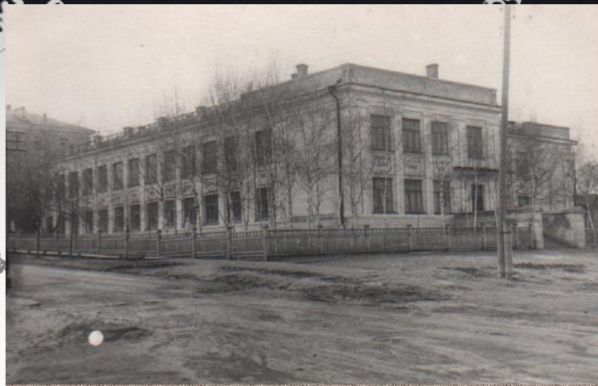
Первая школа на перекрестке улицы Володарского и Ленинградской.

Первые школы нашего города №1 и №2 были построены еще в 1918 году. Школа №1 была создана на базе бывшей Мариинской женской гимназии. В школе было как семилетнее, так и девятилетнее образование. В 1931 году она стала «образцовой школой», одной из пяти подобных в Ленинградской области.