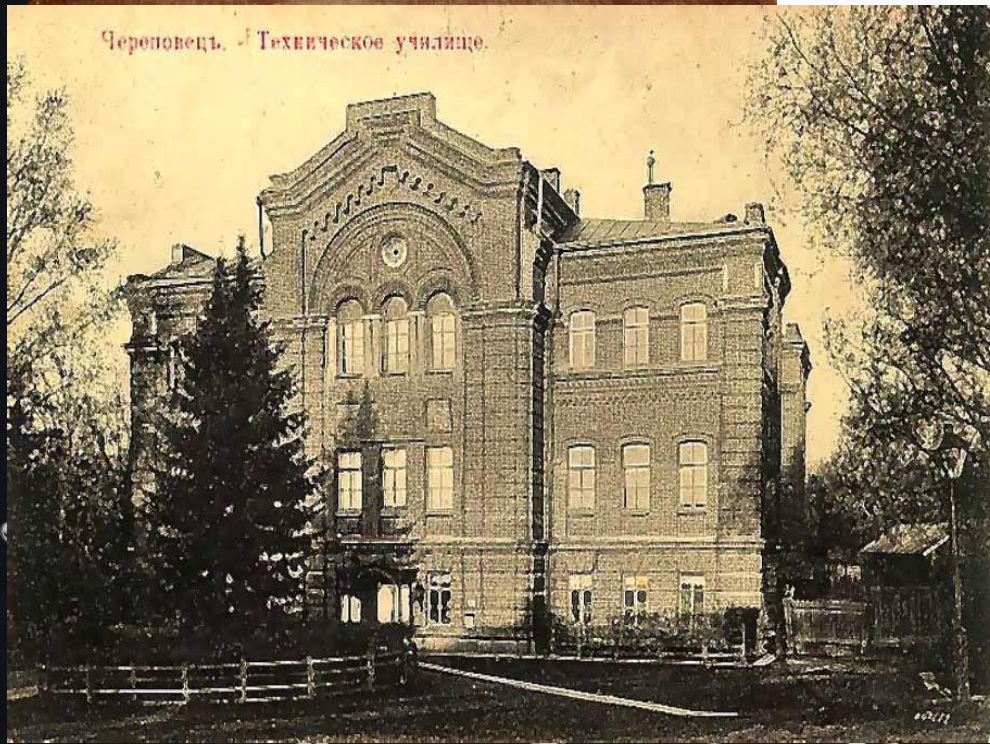
Черновцы. Техническое училище.