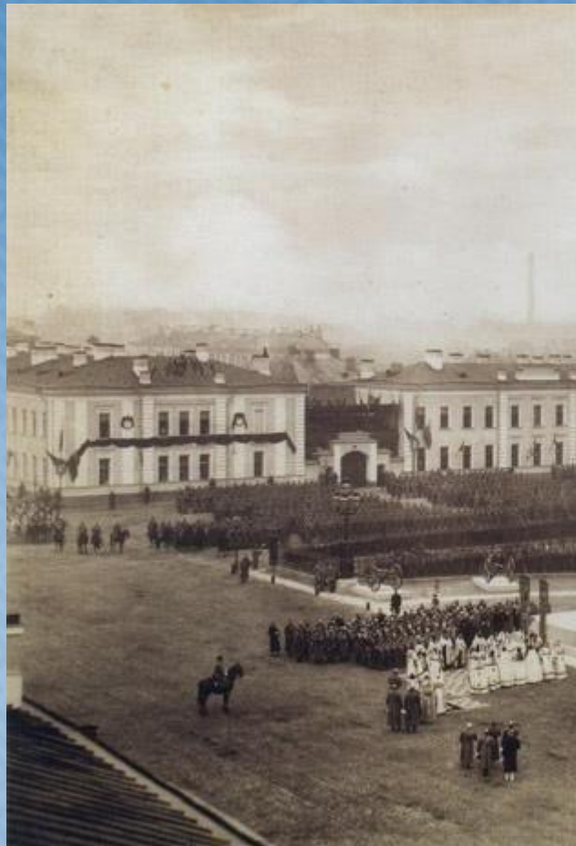
Торжественная церемония открытия памятника перед Троицким собором. 1886 год.