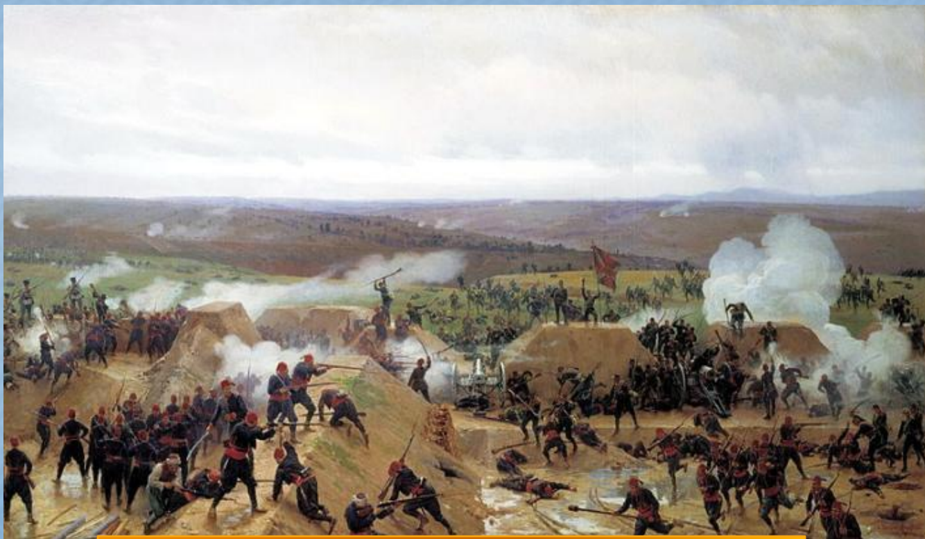
Николай Дмитриев-Оренбургский. «Захват Гривицкого редута под Плевной»