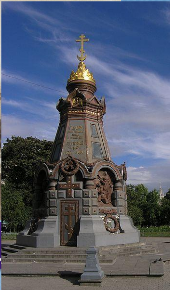
Памятник героям Плевны в Ильинском сквере.