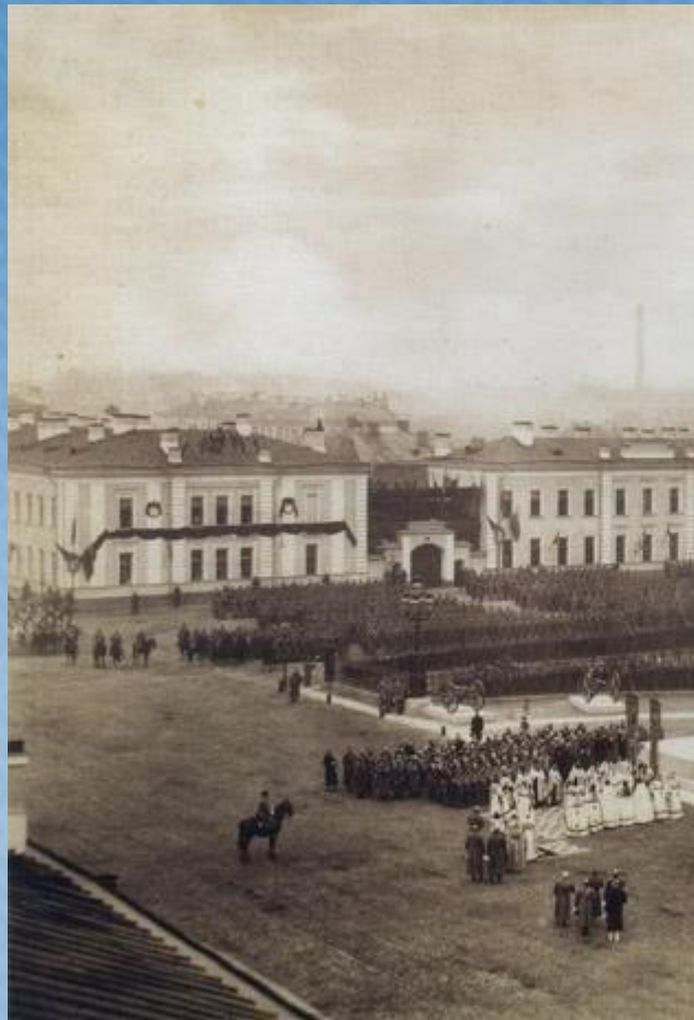
Торжественная церемония открытия памятника перед Троицким собором. 1886 год.