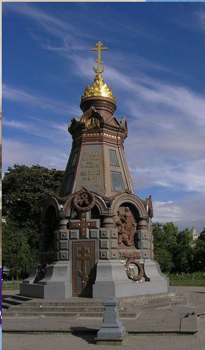
Памятник героям Плевны в Ильинском сквере.