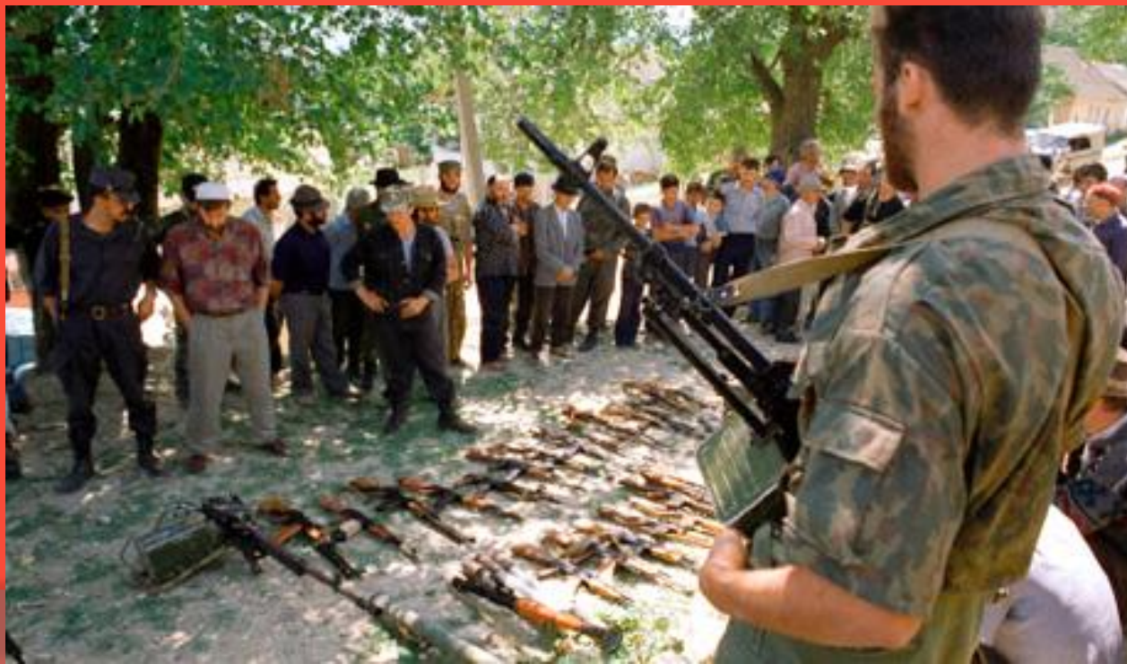
Задержание участников бандгруппы Бараева

Боевики, напротив, сделали ставку на интернационализацию конфликта, вовлекая в свою борьбу вооруженные отряды нечеченского происхождения. К началу 2005, после уничтожения Масхадова, Хаттаба, Бараева, Абу аль-Валида и многих других полевых командиров, интенсивность диверсионно-террористической деятельности боевиков значительно снизилась.