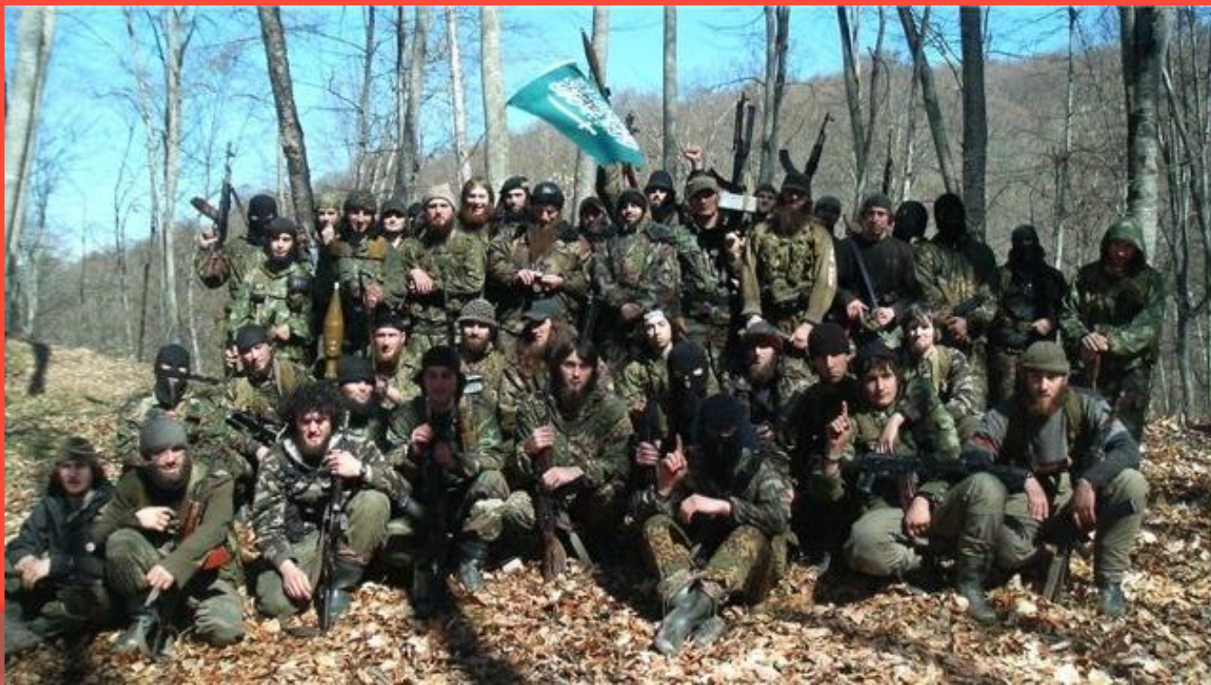
Отряд чеченских боевиков

11 декабря 1994 г. Президент Российской Федерации Борис Ельцин подписал Указ № 2169 «О мерах по обеспечению законности, правопорядка и общественной безопасности на территории Чеченской Республики». В тот же день подразделения Объединённой группировки войск (ОГВ), состоявшие из частей Министерства обороны и Внутренних войск МВД вступили на территорию Чечни. Войска были разделены на три группы и входили с трёх разных сторон — с запада (из Северной Осетии через Ингушетию), северо-запада (из Моздокского района Северной Осетии, непосредственно граничащего с Чечнёй) и востока (с территории Дагестана).