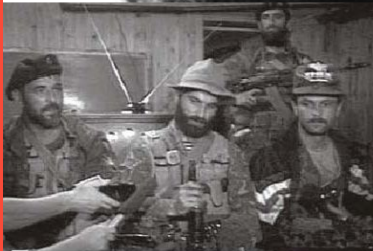
Террористы во время переговоров. В центре - командир отряда Шамиль Басаев. 15 июня 1995 г. г. Буденновск.