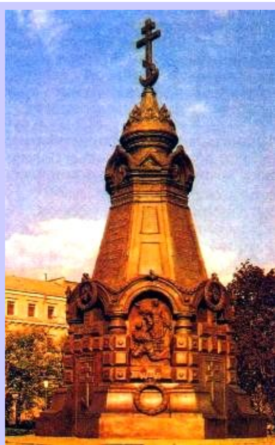
Памятник павшим под Плевной в Москве.

Война на Балканах завершила почти 400-летнюю национальную борьбу балканских народов. Россия восстановила свой военный престиж и завоевала огромный авторитет среди балканского населения.