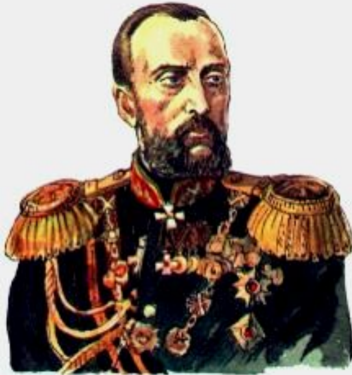
Николай Николаевич. Главнокомандующий русской армии.

12.4.1877 г. Александр II объявил войну. Соотношение сил складывалось в пользу России, но военная реформа не была завершена и армия испытывала недостаток в новейшем вооружении и высших командирских кадрах.