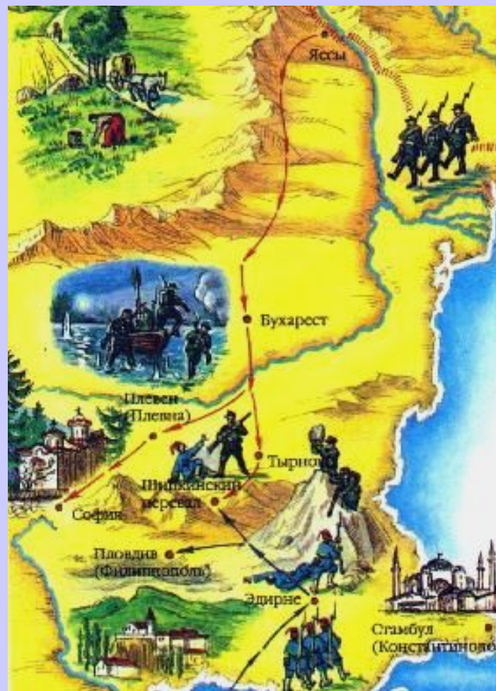
Карта боевых действий.

Летом 1877 г. русская армия вступила на территорию Румынии и перешла р. Дунай. Болгары восторженно встречали освободителей.