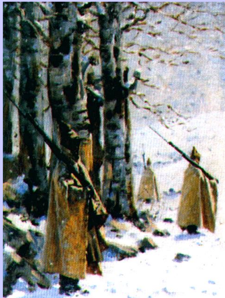
В.Верещагин. Пикет на Балканах

Пока русское командование выясняло расположение своих отрядов турки неожиданно ударили по Плевне и заняли город, создав угрозу для тыла русской армии.