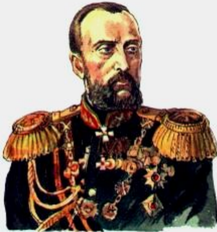
Николай Николаевич. Главнокомандующий русской армии.

12.4.1877 г. Александр II объявил войну. Соотношение сил складывалось в пользу России, но военная реформа не была завершена и армия испытывала недостаток в новейшем вооружении и высших командирских кадрах.