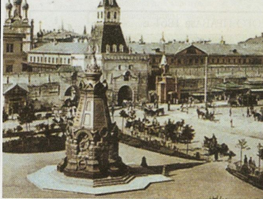
Памятник-часовня гренадерам, павшим под Плевной. Москва, площадь Ильинских ворот, 1901 г.