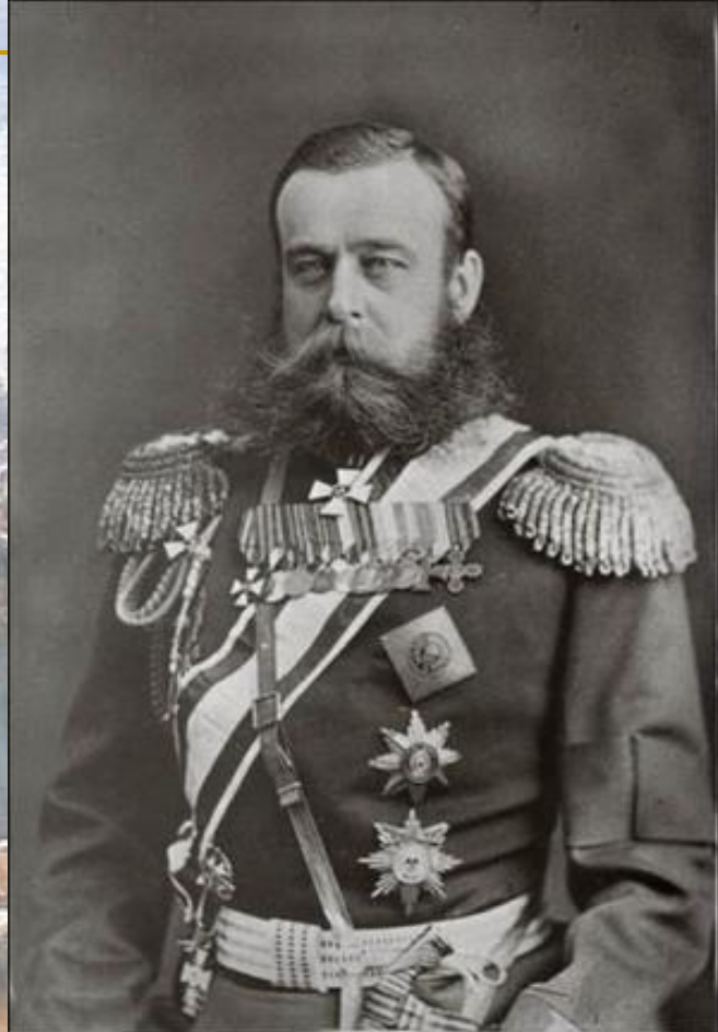
Генерал Криденер Н. П.