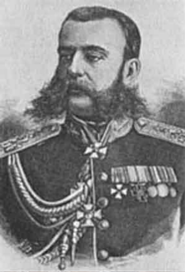
Генерал Скобелев М. Д.