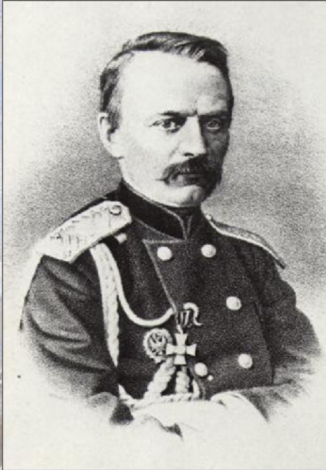
Генерал Столетов Н. Г.