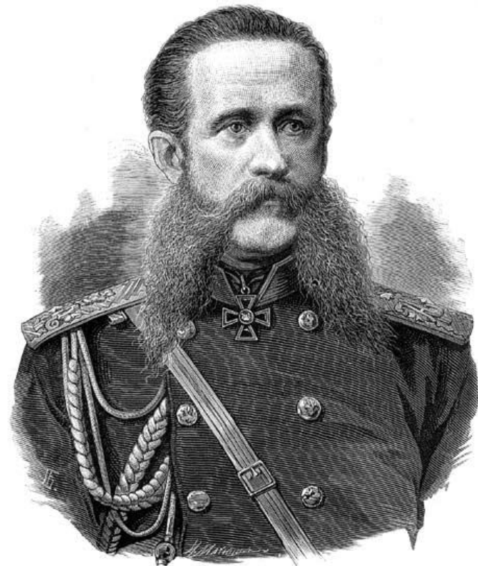
Генерал Гурко Н. В.