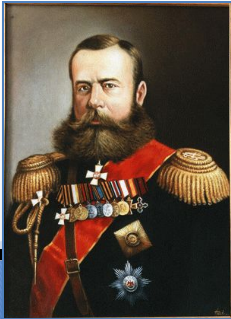
М. Д. Скобелев

Яркая и популярная личностью среди русских полководцев второй половины XIX в. Скобелев заботливо относился к солдатам, тщательно готовил войска к боям, личным примером увлекал их в атаку. Солдаты верили в его неуязвимость, поскольку, лично участвуя в самых кровавых боях, он ни разу не был ранен. Болгарский народ считал его своим национальным героем.