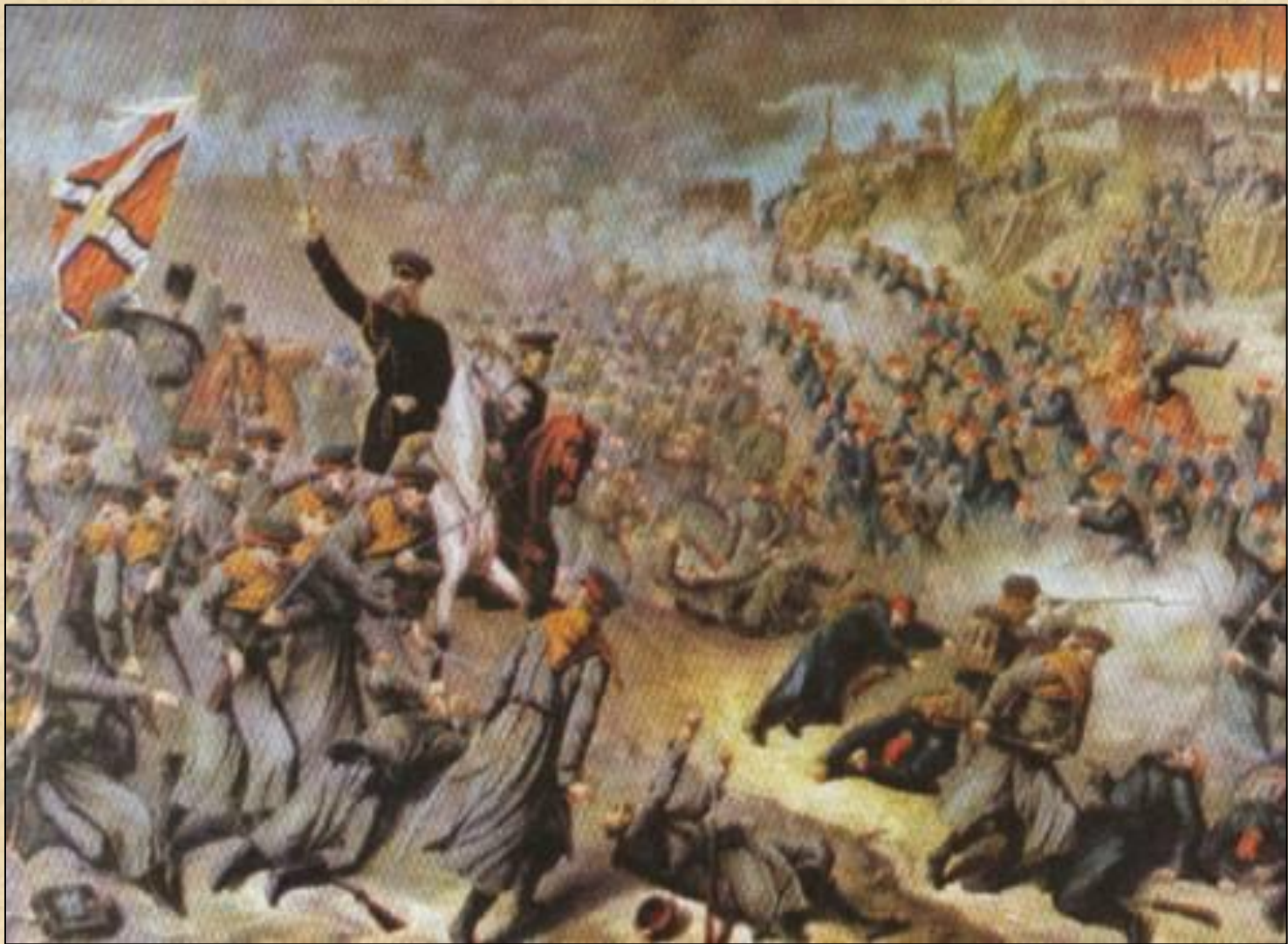
7. Осада Плевны (Э.Н.Тотлебен) – сдалась в ноябре 1878