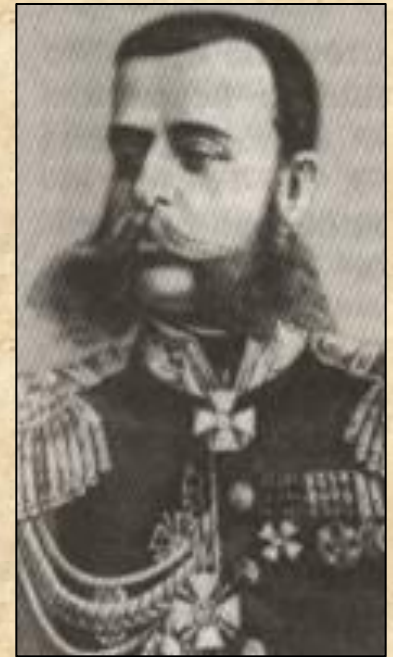
М.Д.Скобелев «белый генерал»

9. Наступление на Стамбул ➔ взят г.Сан-Стефано