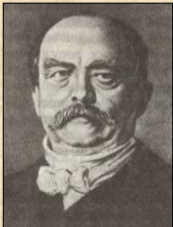
Отто фон Бисмарк