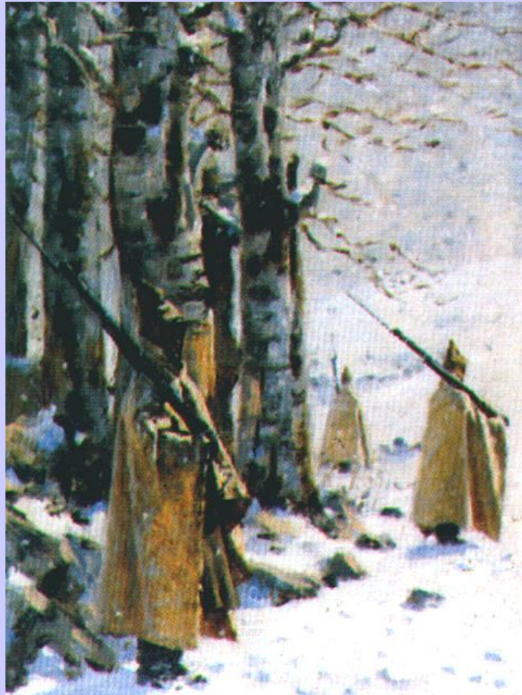
В.Верещагин. Сикет на Балканах

Пока русское командование выясняло расположение своих отрядов турки неожиданно ударили по Плевне и заняли город, создав угрозу для тыла русской армии.