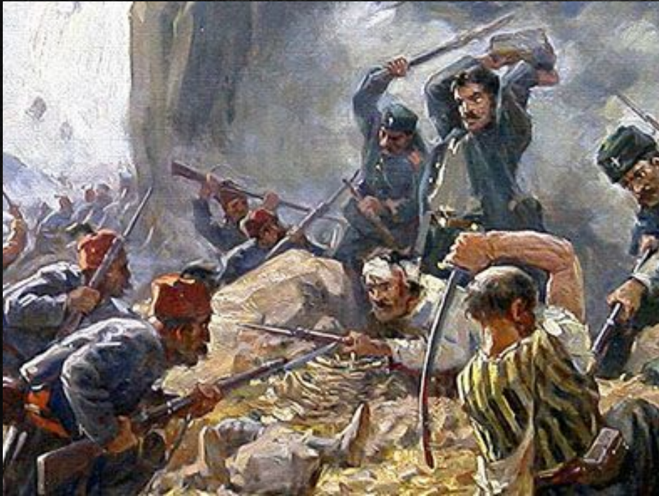
Битва на горе Шипка