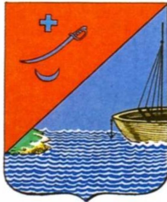
Герб г. Измаила