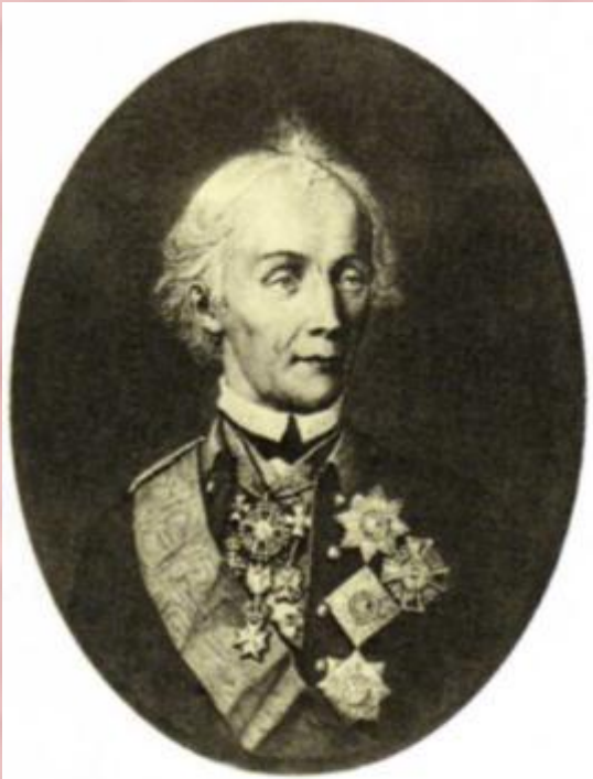
А. В. Суворов. Гравюра Н. Уткина с портрета работы И.-Г. Шмидта