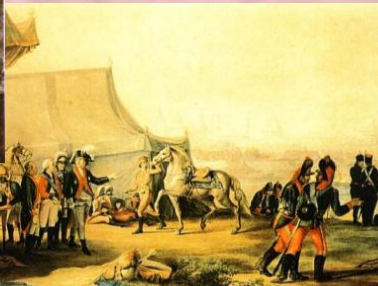
Лагерь Потёмкина под Очаковым.