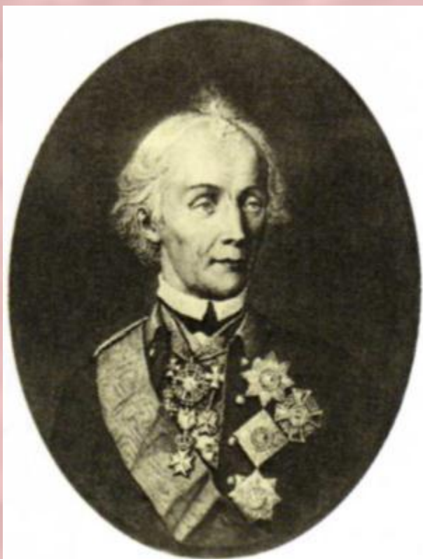
А. В. Суворов.