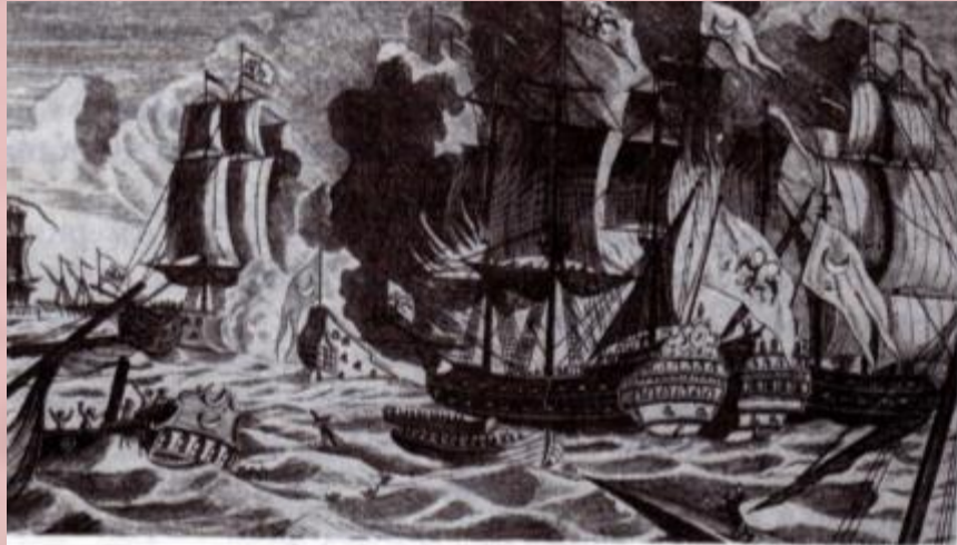
Бой в Хиосском проливе — первый этап Чесменского сражения. Гравюра XVIII в.