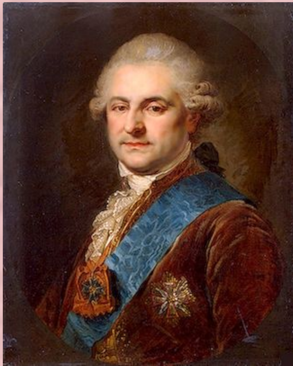
Король Станислав Понятовский