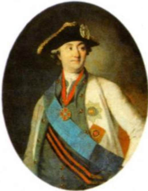
Портрет графа А. Г. Орлова- Чесменского. 1779 г. Худ. К. Христинек