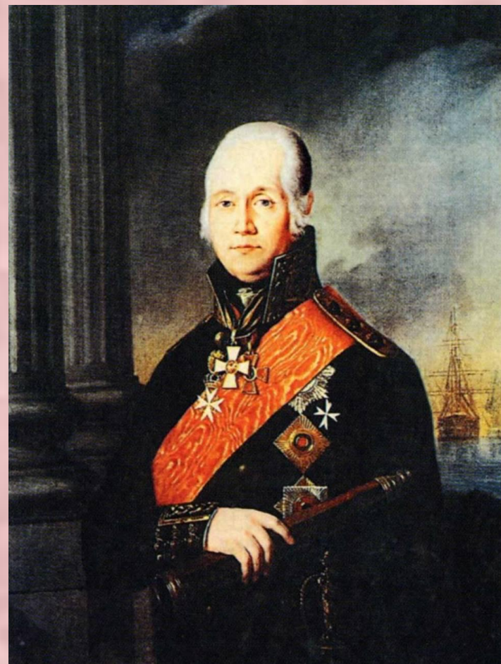
Адмирал Ф.Ф. Ушаков