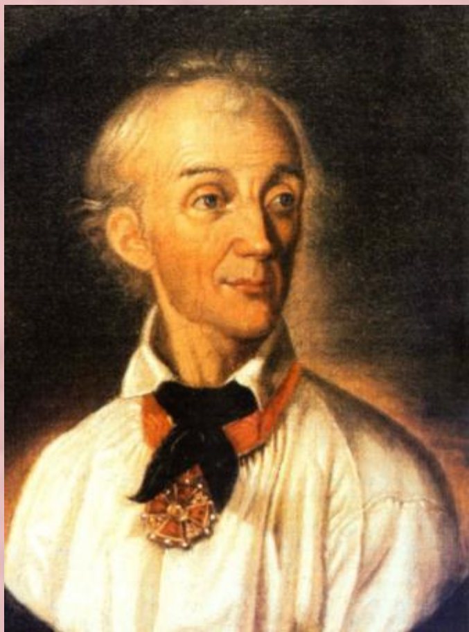
Генерал-фельдмаршал А.В. Суворов-Рымнинский