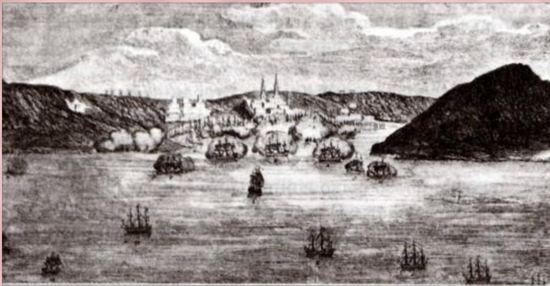
Чесменский бой. Гравюра. XVIII в.