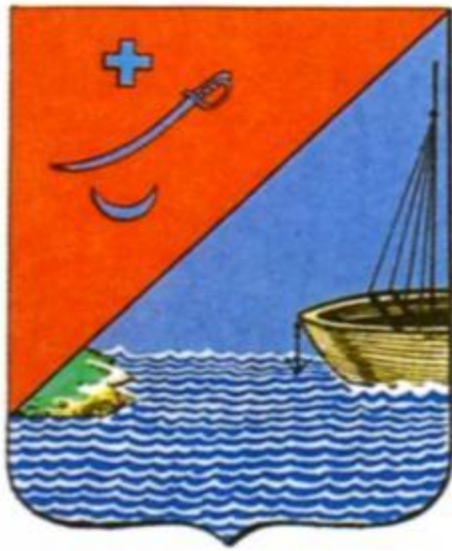
Герб г. Измаила