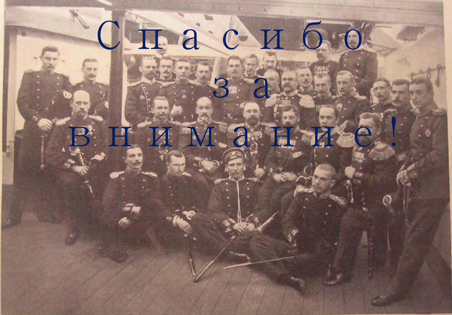
ГРУППА ОФИЦЕРОВЪ ПОГИБШАГО ВЪ ЦУСИМСКОМЪ СРАЖЕНІИ БРОНЕНОСЦА «КНЯЗЬ СУВОРОВЪ». (На немъ генераль-адъютантъ Рожественскій держалъ свой флагъ. — Въ центрѣ группы командиръ броненосца капитанъ 1-го ранга Игнаціусъ, рядомъ съ нимъ, слѣва — капитанъ 2-го ранга Клазо).