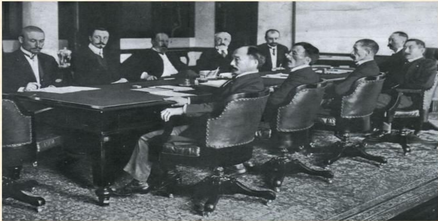
Русско-Японская война. Переговоры мира. 1905 год.

Ход войны явно складывался в пользу Японии. Однако ее экономика была истощена войной. Это заставило Японию пойти на мирные переговоры. В Портсмуте, 9 августа участники русско-японской войны начали мирную конференцию.