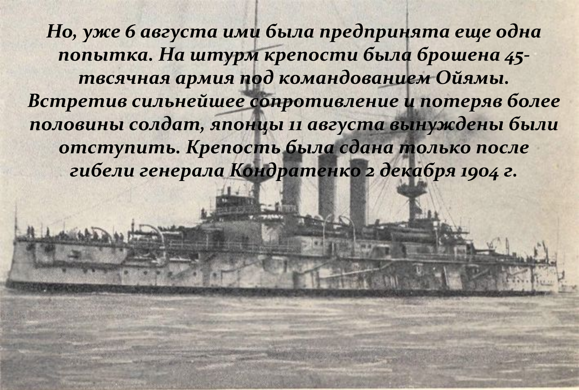
ЯПОНСКИЙ ЭСКАДРЕННЫЙ БРОНЕНОСЕЦЬ «ШИКИШАМА».

Но, уже 6 августа ими была предпринята еще одна попытка. На штурм крепости была брошена 45-тысячная армия под командованием Ойямы. Встретив сильнейшее сопротивление и потеряв более половины солдат, японцы 11 августа вынуждены были отступить. Крепость была сдана только после гибели генерала Кондратенко 2 декабря 1904 г.