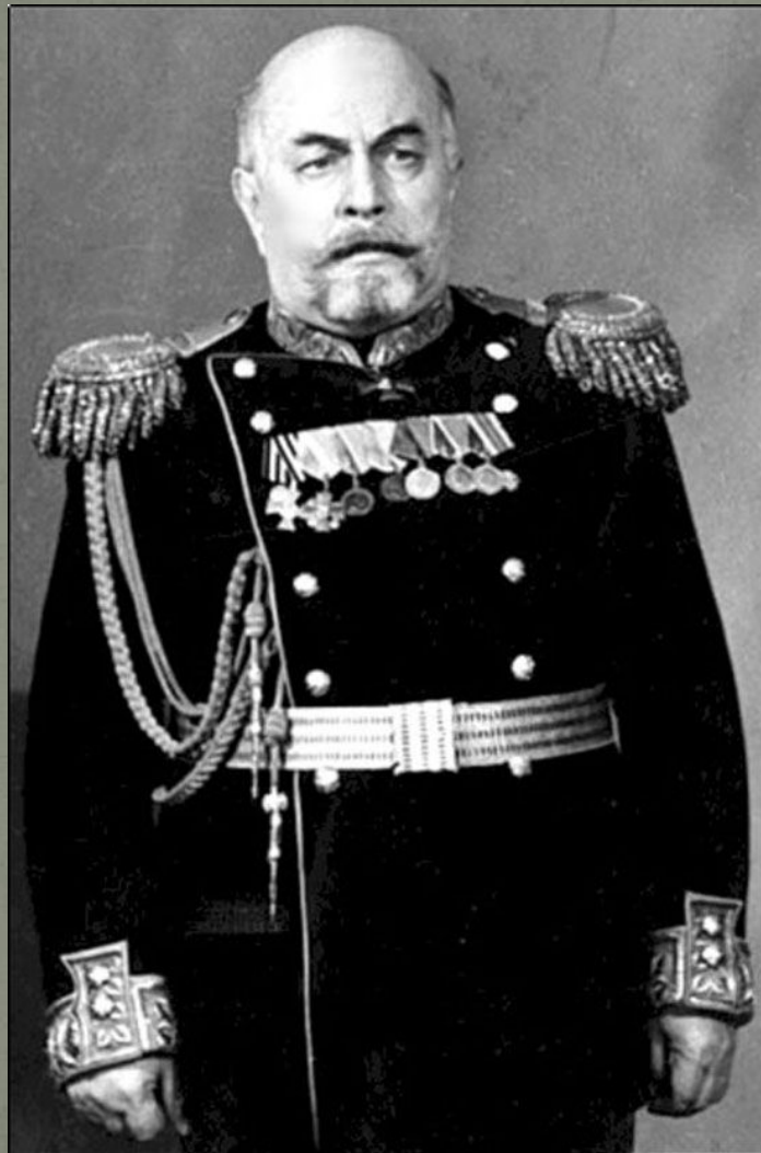
Анатолий Михайлович Стессель