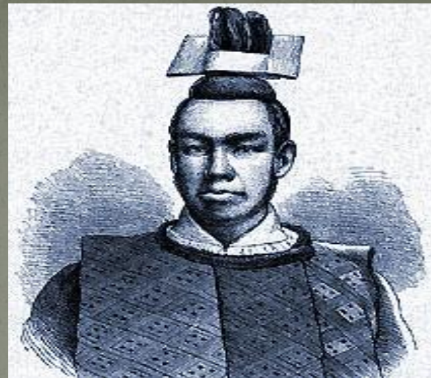
Император Японии Муцухито Мэйдзи

Япония решила не ждать, пока русские протянут рельсы до причалов Владивостока- ее эскадра вошла в Печилийский залив –так началась война без объявления –война с Китаем.