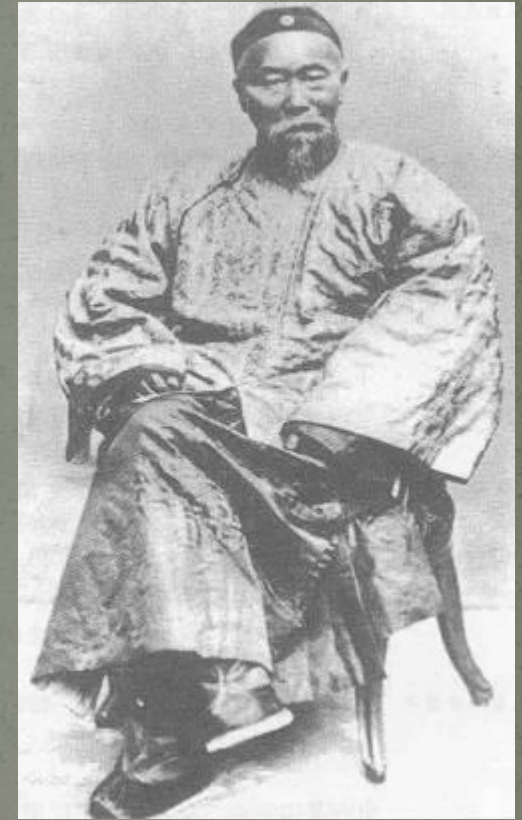
Ли Хун Чжан