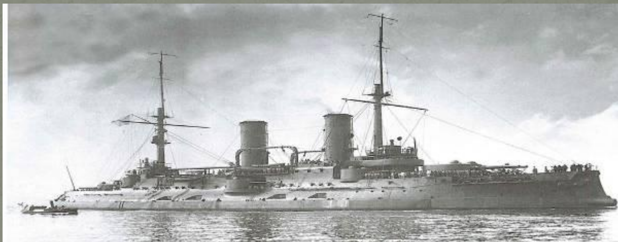
Флагман 1 Тихоокеанского флота «Цесаревич»

Был конец июля , когда адмирал Витгефт решился вывести 1-ю Тихоокеанскую эскадру во Владивосток. Бой в Желтом море с японской эскадрой складывался неплохо: японцы проигрывали. Овладение Порт-Артуром дорого стоило японцам, которые под его стенами потеряли более 100 тыс. человек. Вместе с тем, взяв крепость, противник смог усилить свои войска, оперировавшие в Маньчжурии. Стоявшая в Порт-Артуре эскадра была фактически уничтожена еще летом 1904 г. в ходе неудачных попыток прорваться во Владивосток.