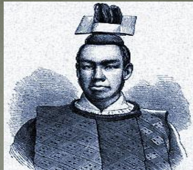
Император Японии Муцухито Мэйдзи

Япония решила не ждать, пока русские протянут рельсы до причалов Владивостока- ее эскадра вошла в Печилийский залив –так началась война без объявления –война с Китаем.