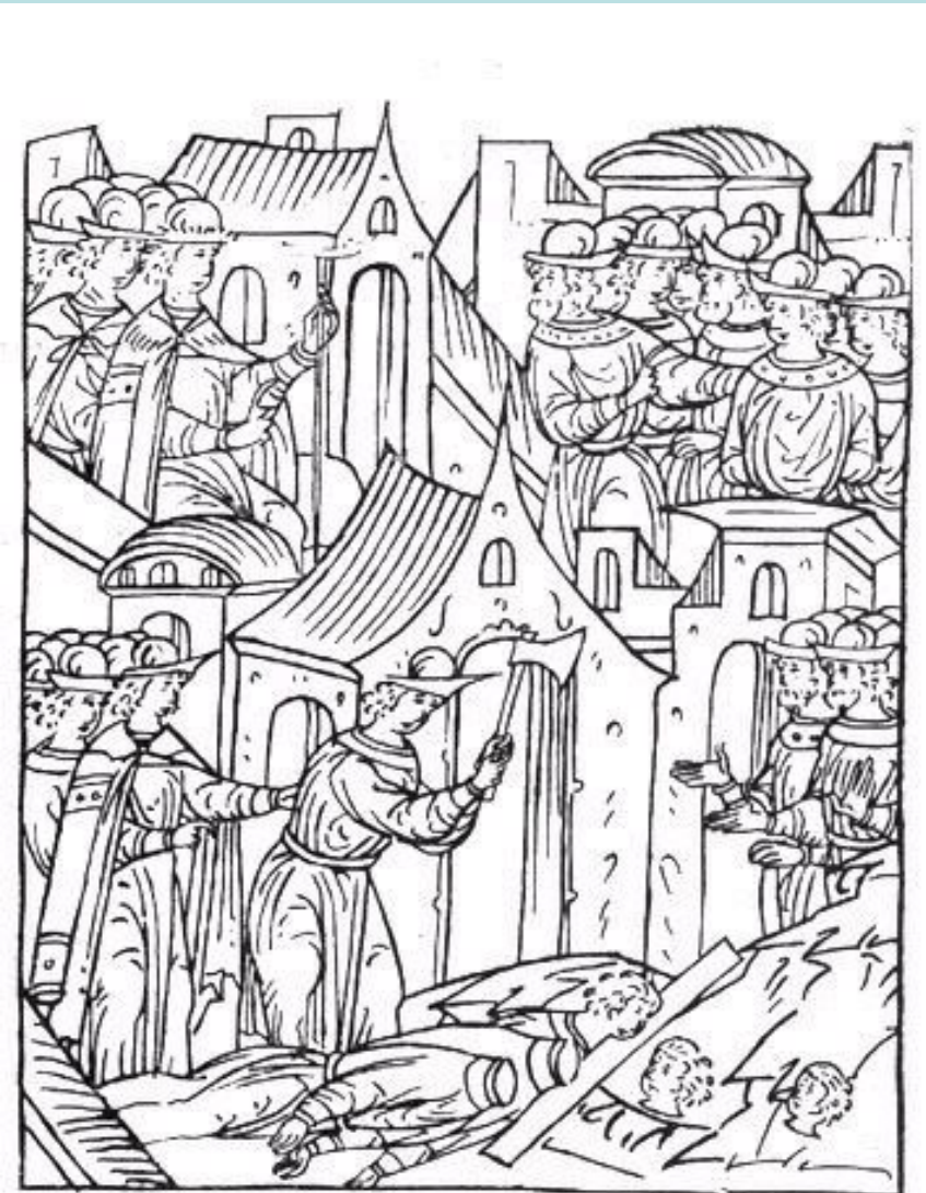
Казни бояр в 1546 г.

Первый приказ о казни отдал в 13 лет – велел псарям убить князя Андрея Шуйского