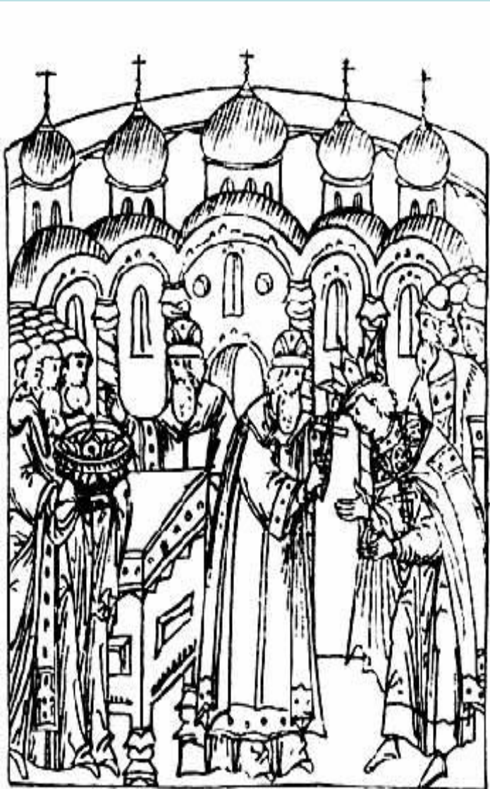
Венчание Ивана IV на царство