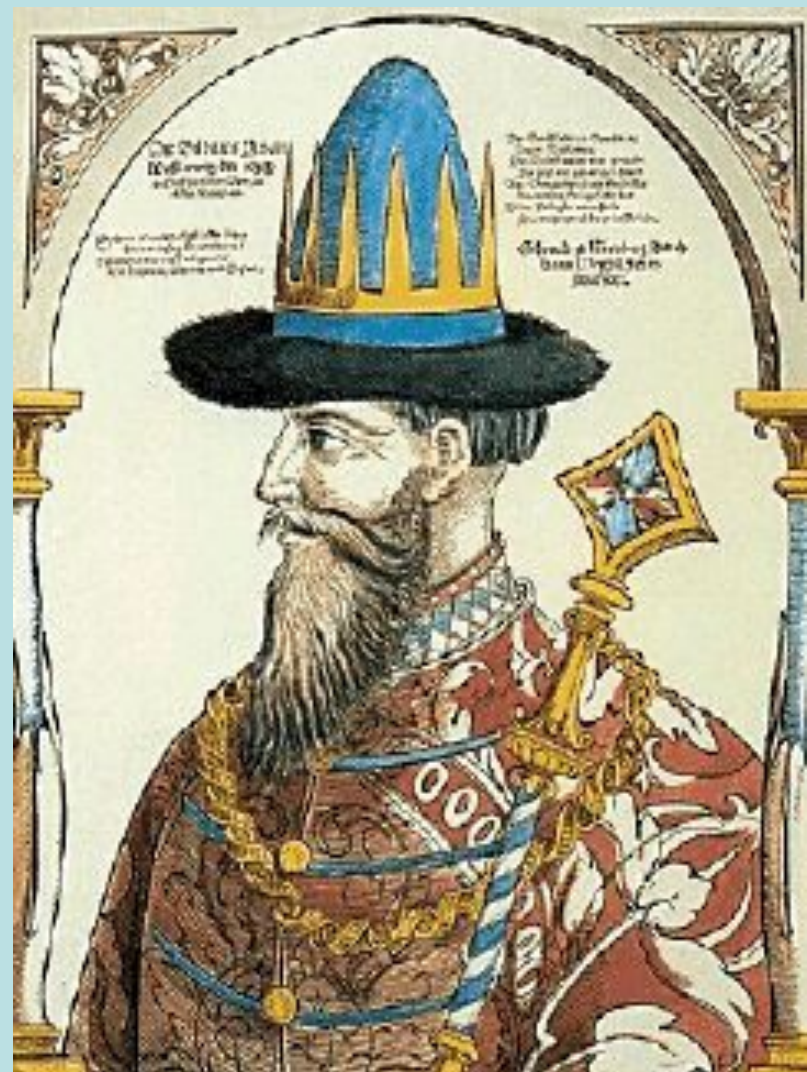
Иван IV. Старинная немецкая гравюра