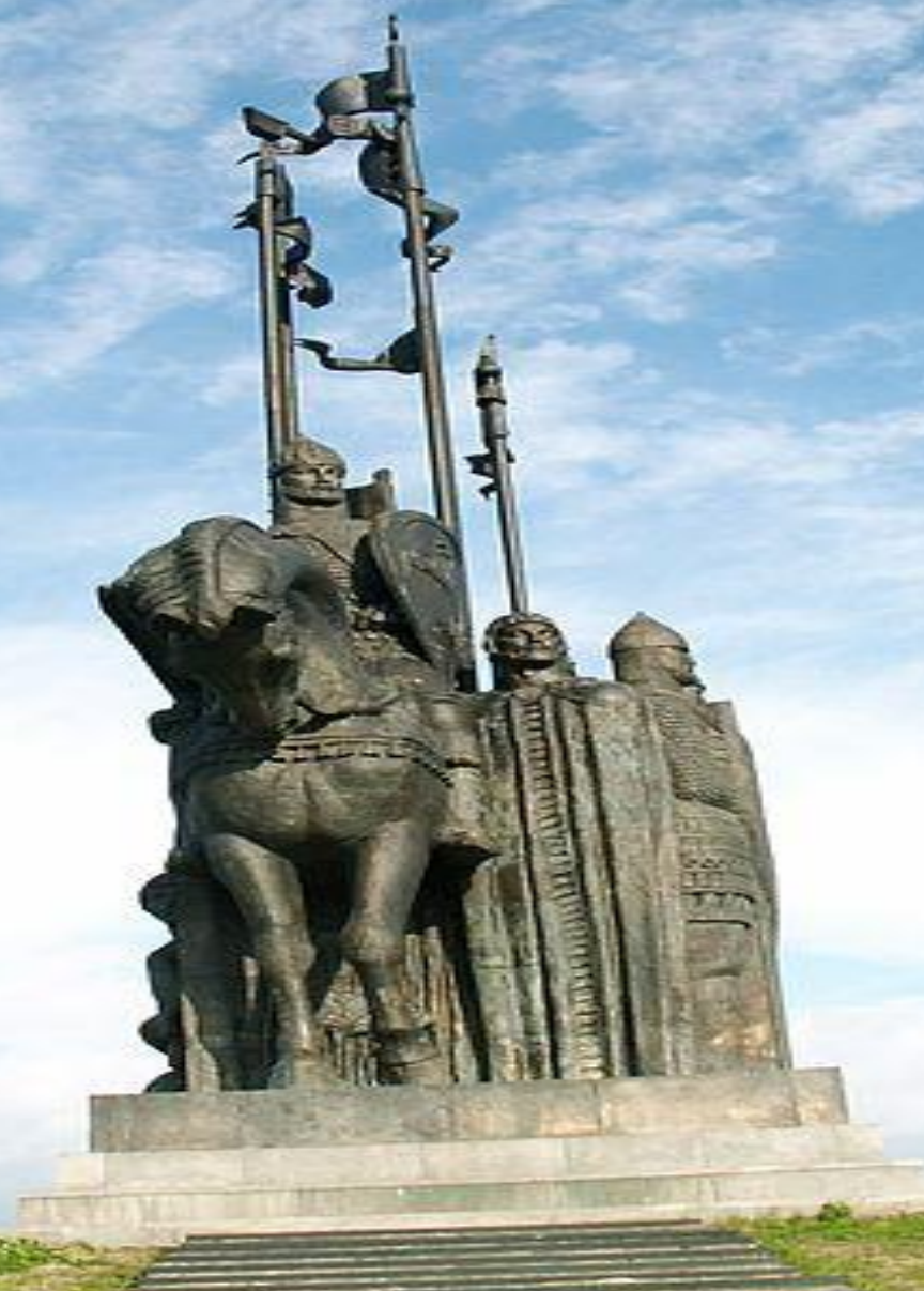
Памятник А.Невскому во Пскове