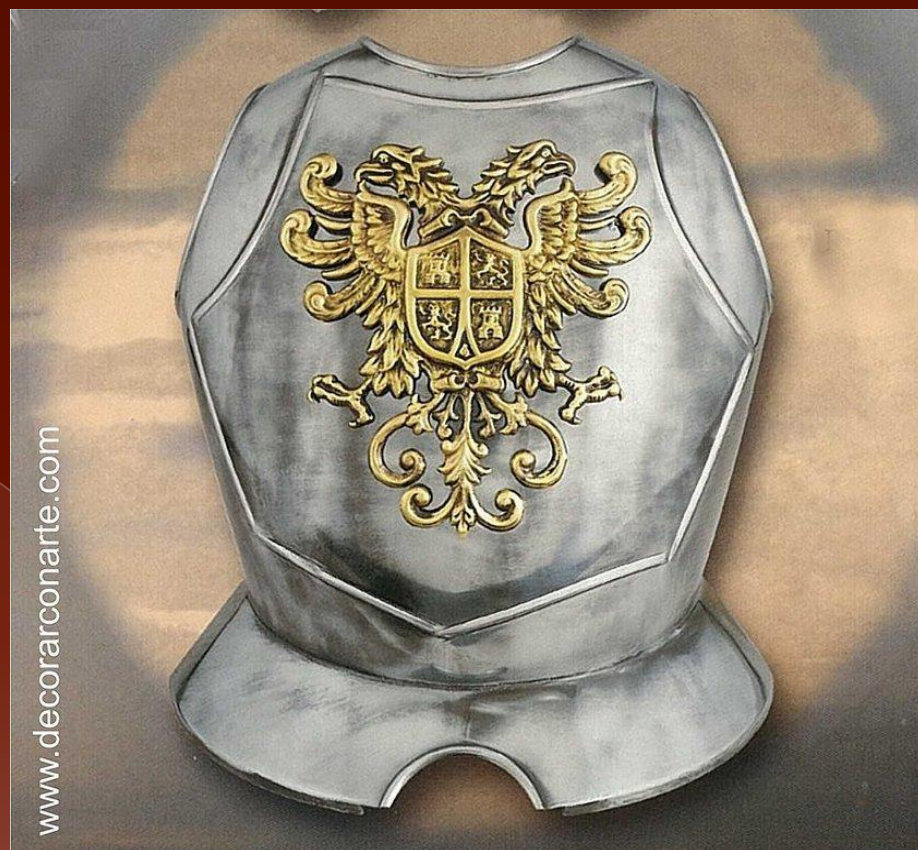
Кіраса рицарська з двоголовим орлом