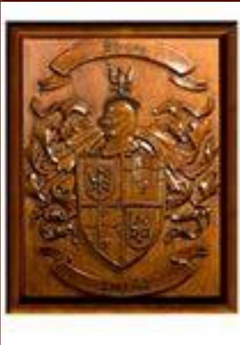
Рицарский герб Харон