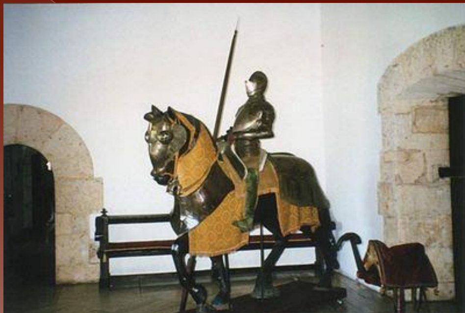
Броня коня та лицаря

У дні різних свят та урочистостей було прийнято влаштовувати турніри, на яких лицарі змагалися у військовому мистецтві. Сутички проходили як один на один, так і між цілими загонами. І хоча лицарі билися тупою зброєю, траплялися і трагічні випадки, (наприклад загибель французького короля Генріха II від осколка списа, що потрапило йому в око). Переможцем оголошувався той, хто першим вибивав супротивника з сідла. Нагородою йому зазвичай служила зброя, обладунки або кінь. Нагородження провадила “королева свята”, обрана самим лицарем.