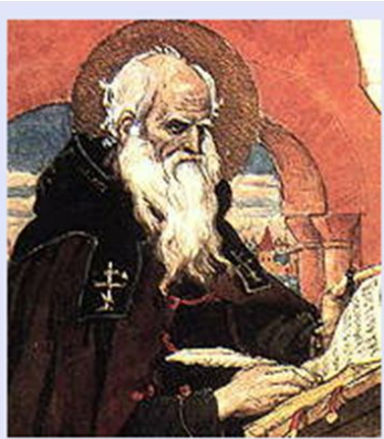
«Нестор-летописец». Эскиз В. М. Васнецова для Владимирского собора в Киеве. Акварель, гуашь, золото.

«Прибытие Рюрика в Ладугу» В. М. Васнецов. 19 век.