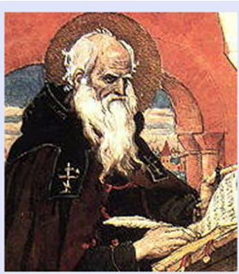
«Нестор-летописец». Эскиз В. М. Васнецова для Владимирского собора в Киеве. Акварель, гуашь, золото.

«Прибытие Рюрика в Ладугу» В. М. Васнецов. 19 век.