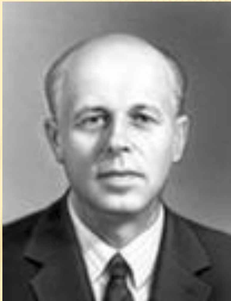
А. Д. САХАРОВ

Андрея Дмитриевича Сахарова знают как крупнейшего ученого современности, как автора выдающихся работ по физике элементарных частиц и космологии. Ему принадлежит основная идея осуществления термоядерного синтеза. Также весь мир знает А. Д. Сахарова как выдающегося общественного деятеля, бесстрашного борца за права человека, за утверждение на Земле примата общечеловеческих ценностей. Много сил отняло у него политическое противостояние. Человек глубоких гуманистических убеждений, высоких нравственных принципов