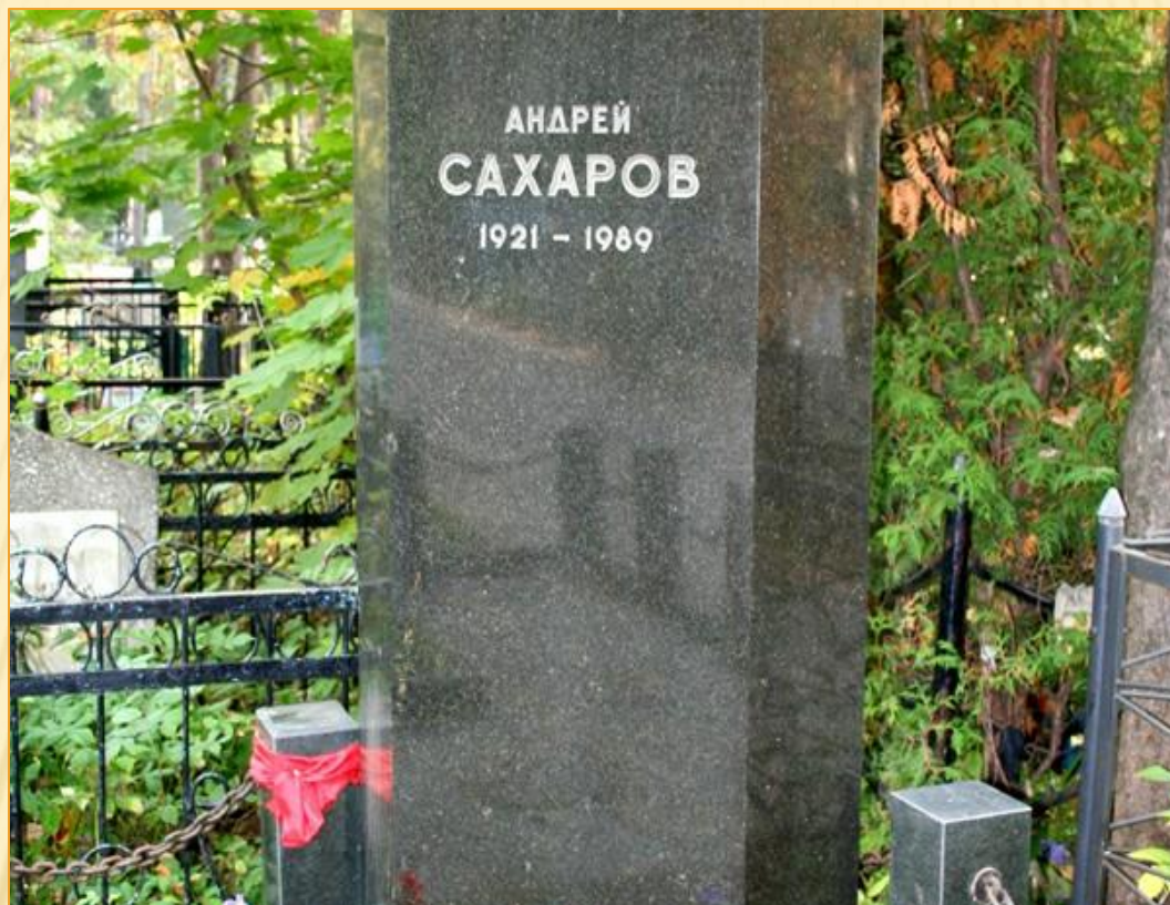
ПАМЯТНИК А. Д. САХАРОВУ