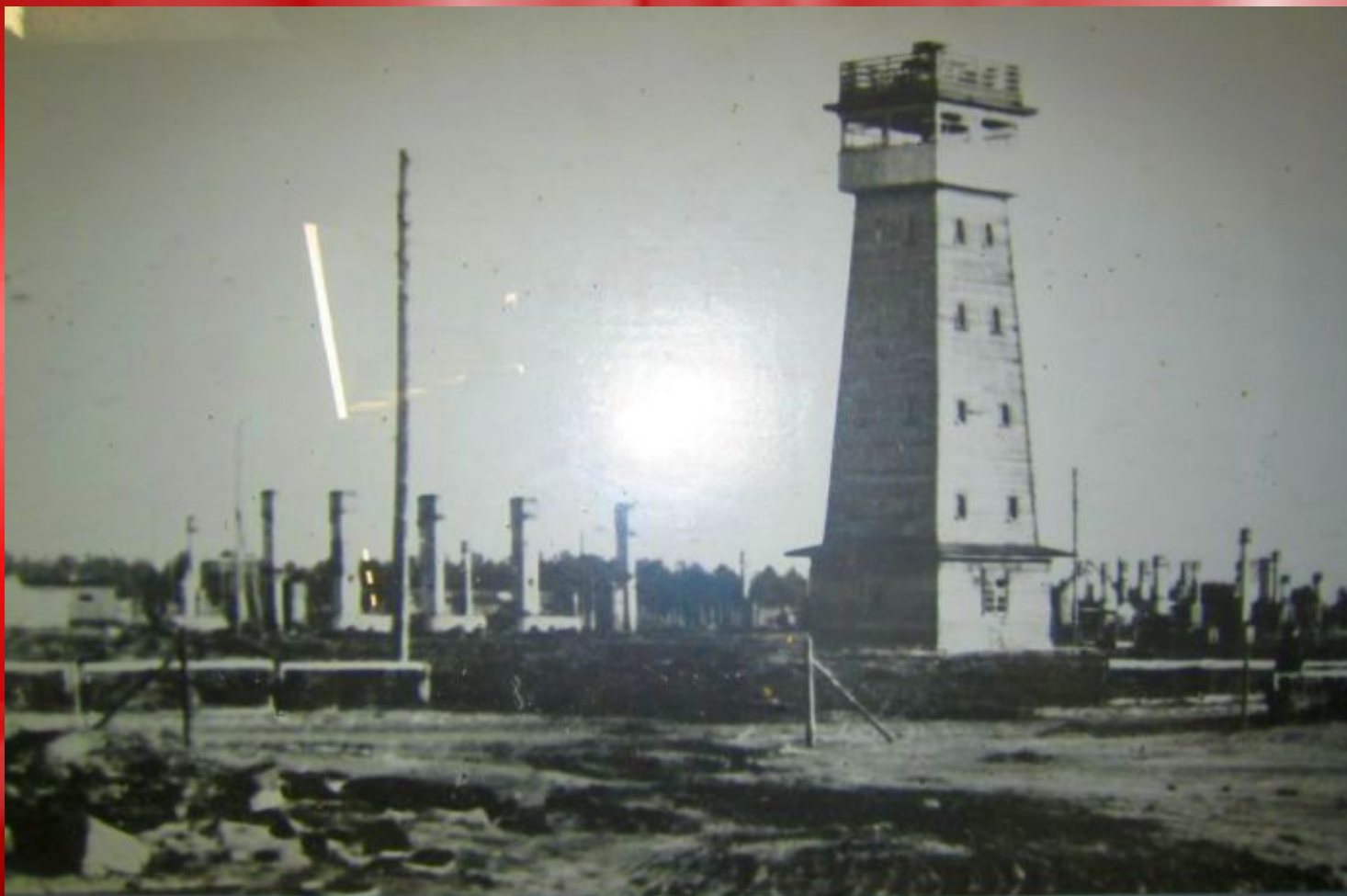
Саласпилсский лагерь смерти, осень 1944 г.