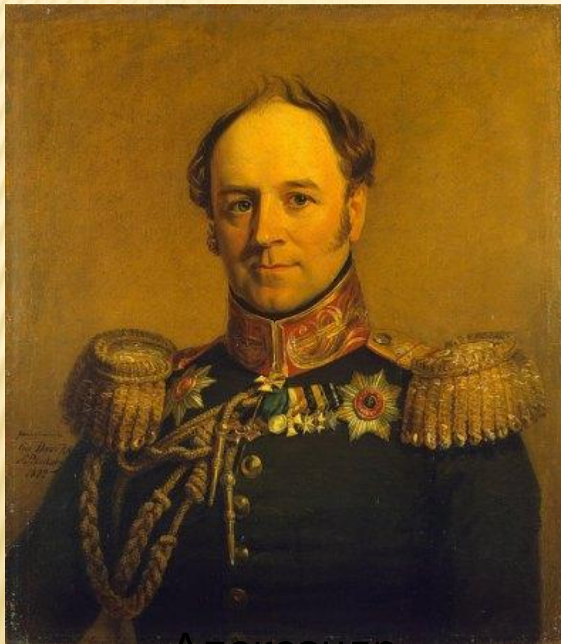
Александр Христофорович Бенкендорф, граф

«... Государь избрал меня для образования высшей полиции, которая покровительствовала бы утесненным и наблюдала за злоумышлениями людей»