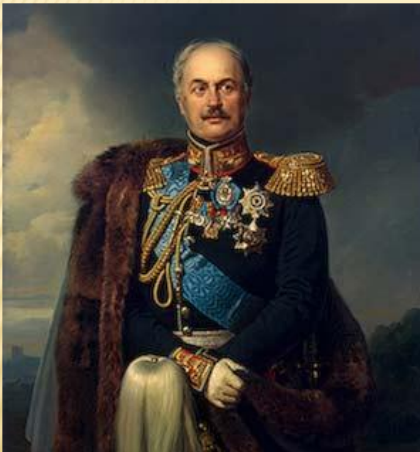
Павел Дмитриевич КИСЕЛЕВ, министр гос. имущества