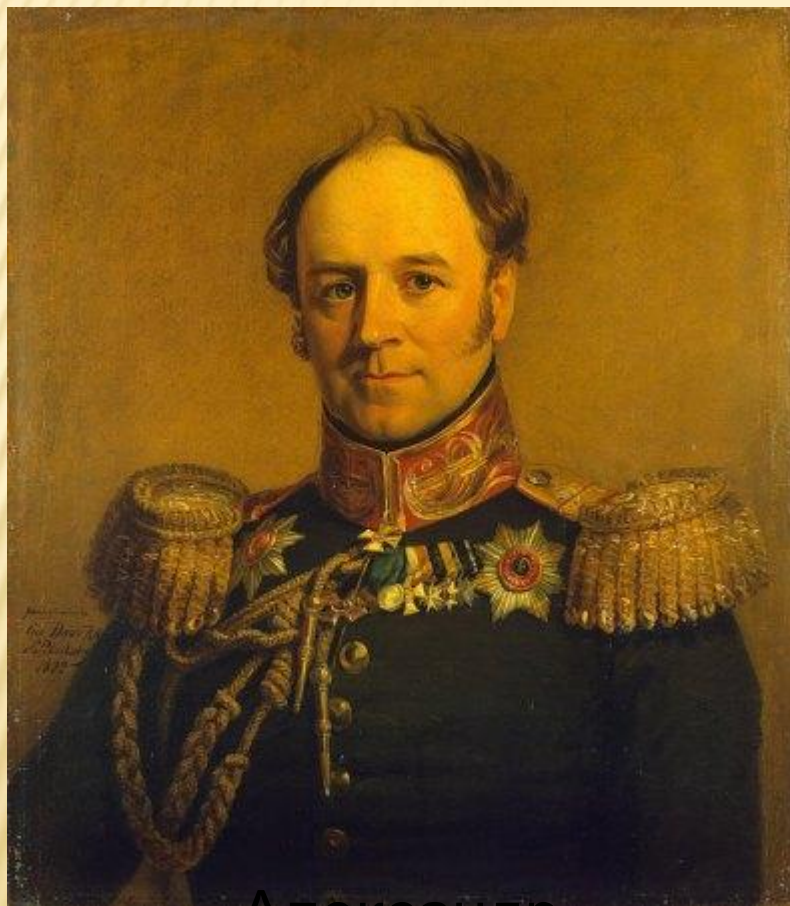
Александр Христофорович Бенкендорф, граф

«... Государь избрал меня для образования высшей полиции, которая покровительствовала бы утесненным и наблюдала за злоумышлениями людей»