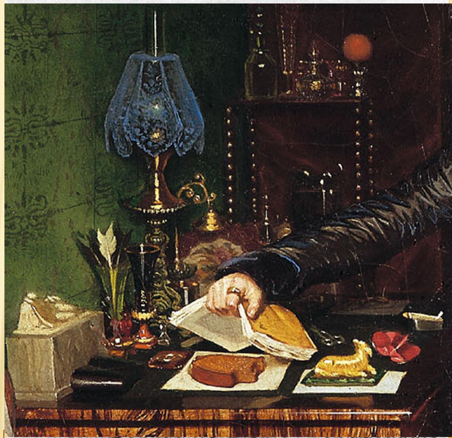
Федотов Павел Андреевич «Завтрак аристократа»