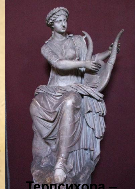
Терпсихора – муза танца