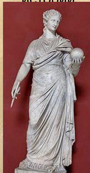
Уrania – муза астрономии