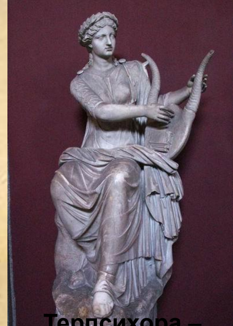
Терпсихора – муза танца