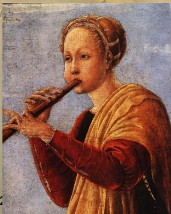
Евтерпа – муза лирической поэзии и музыки