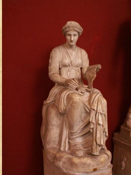
Клио – муза истории

Слово «музей» очень давнее. Оно произошло от слова «муза». Древние греки считали, что прекрасные богини МУЗЫ помогают художникам, поэтам, артистам создавать свои творения.