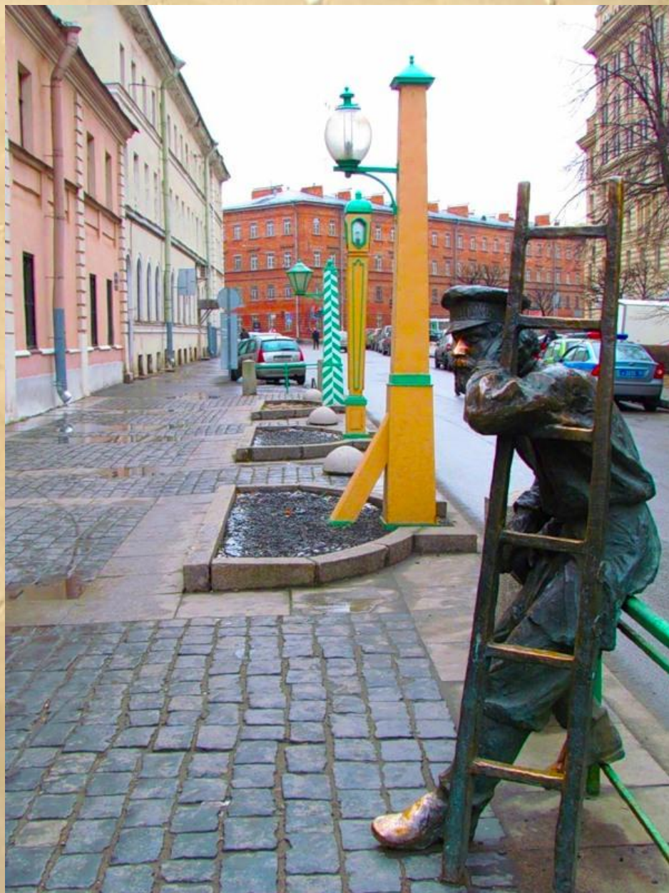
Музей фонарей под открытым небом