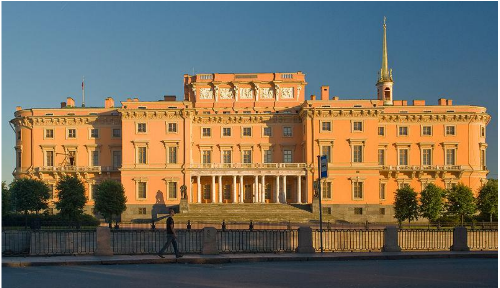
Михайловский дворец. Баженова.