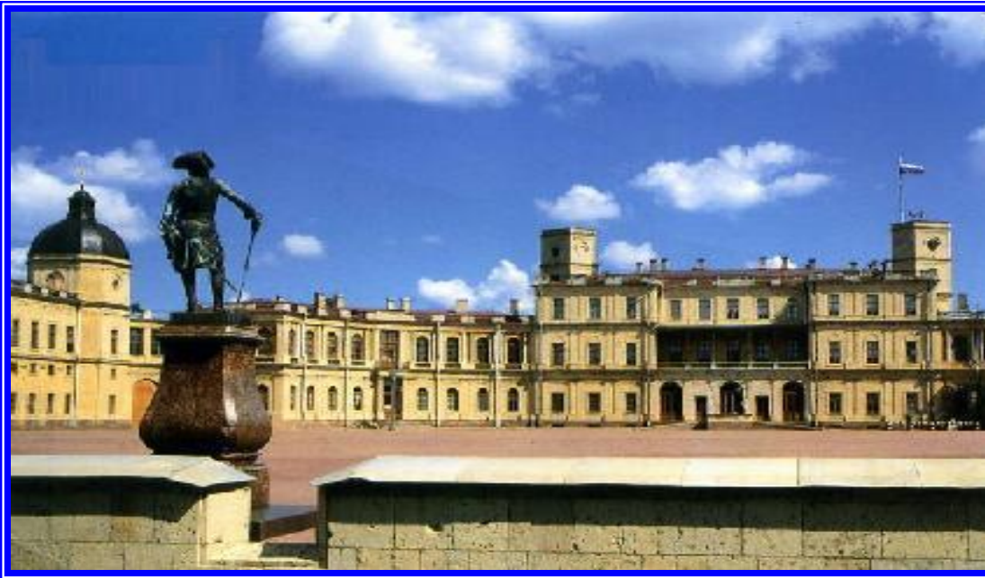
Дворец Павла I в Гатчине

В 1781-1782 гг. Павел и Мария Федоровна совершили путешествие по Европе. Во время поездки Павел вел себя неосторожно, открыто критикуя политику Екатерины. Это стало известно Екатерине, которая по возвращении сына удалила его от двора, подарив Гатчину , где Павел проводил отныне большую часть времени.