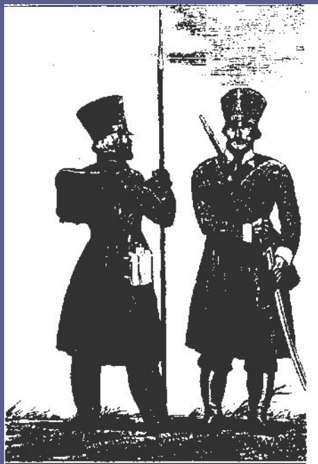
Пеший и конный ратники Пензенского ополчения.