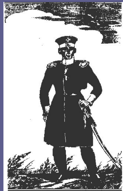
Обер-офицер Симбирского ополчения.