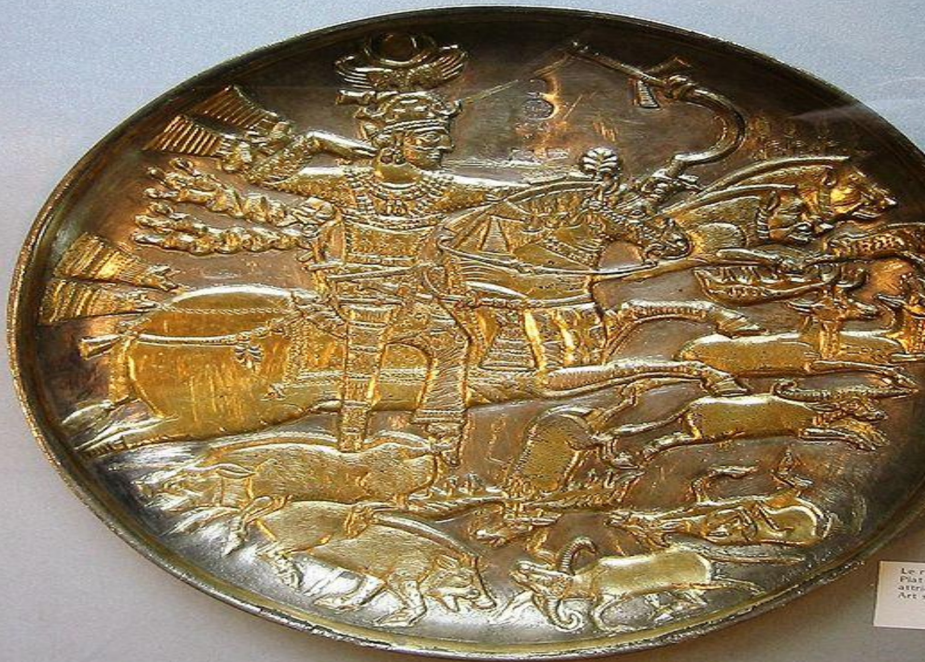
Le r Plat attr Art