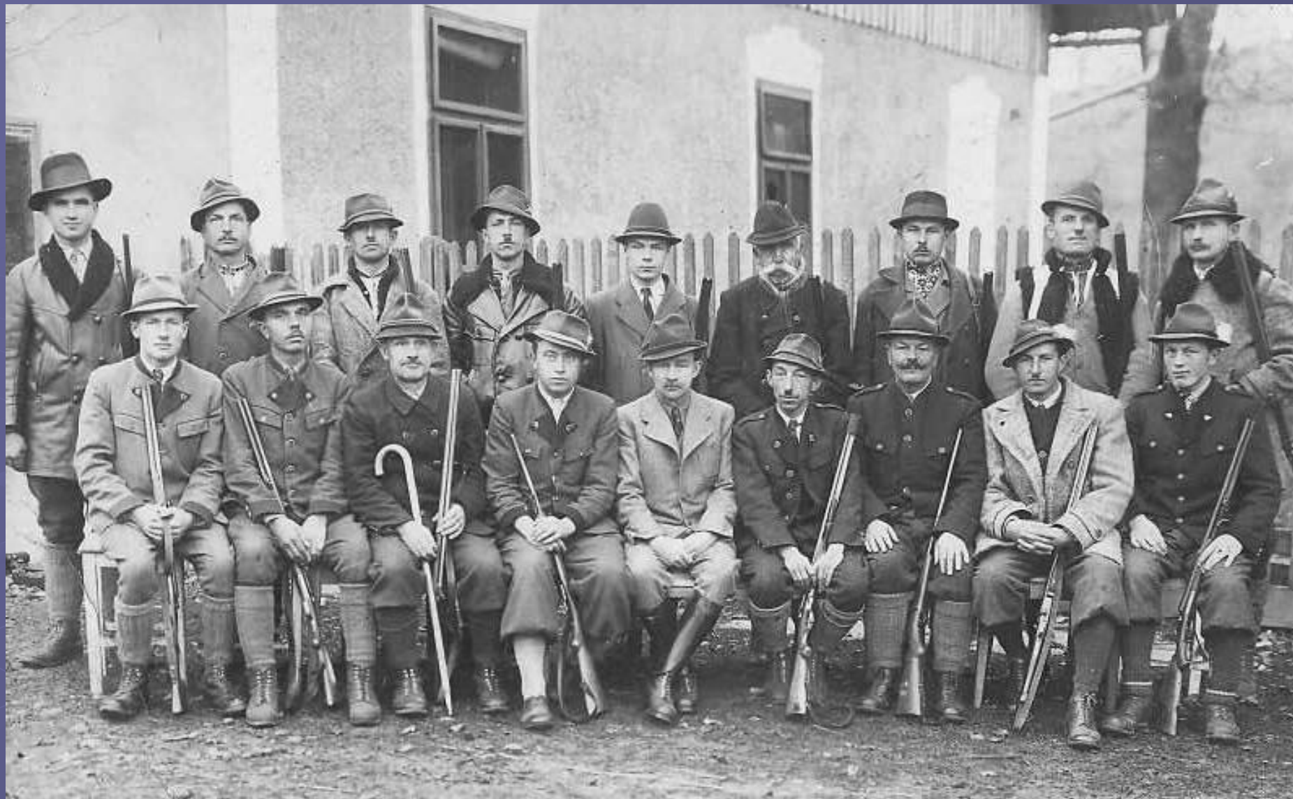
Мисливців с. Лопушна та гості.