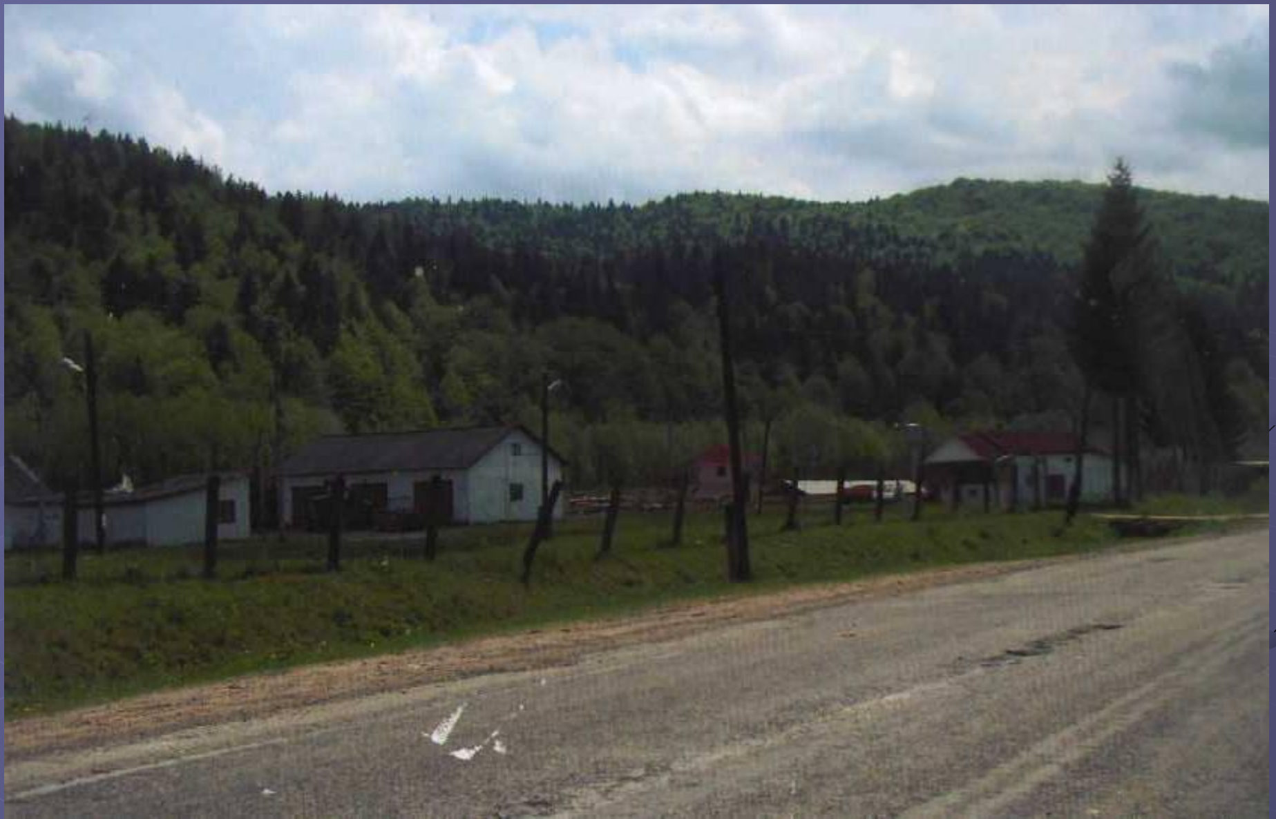
Рибне господарство с. Лопушни 2011р.