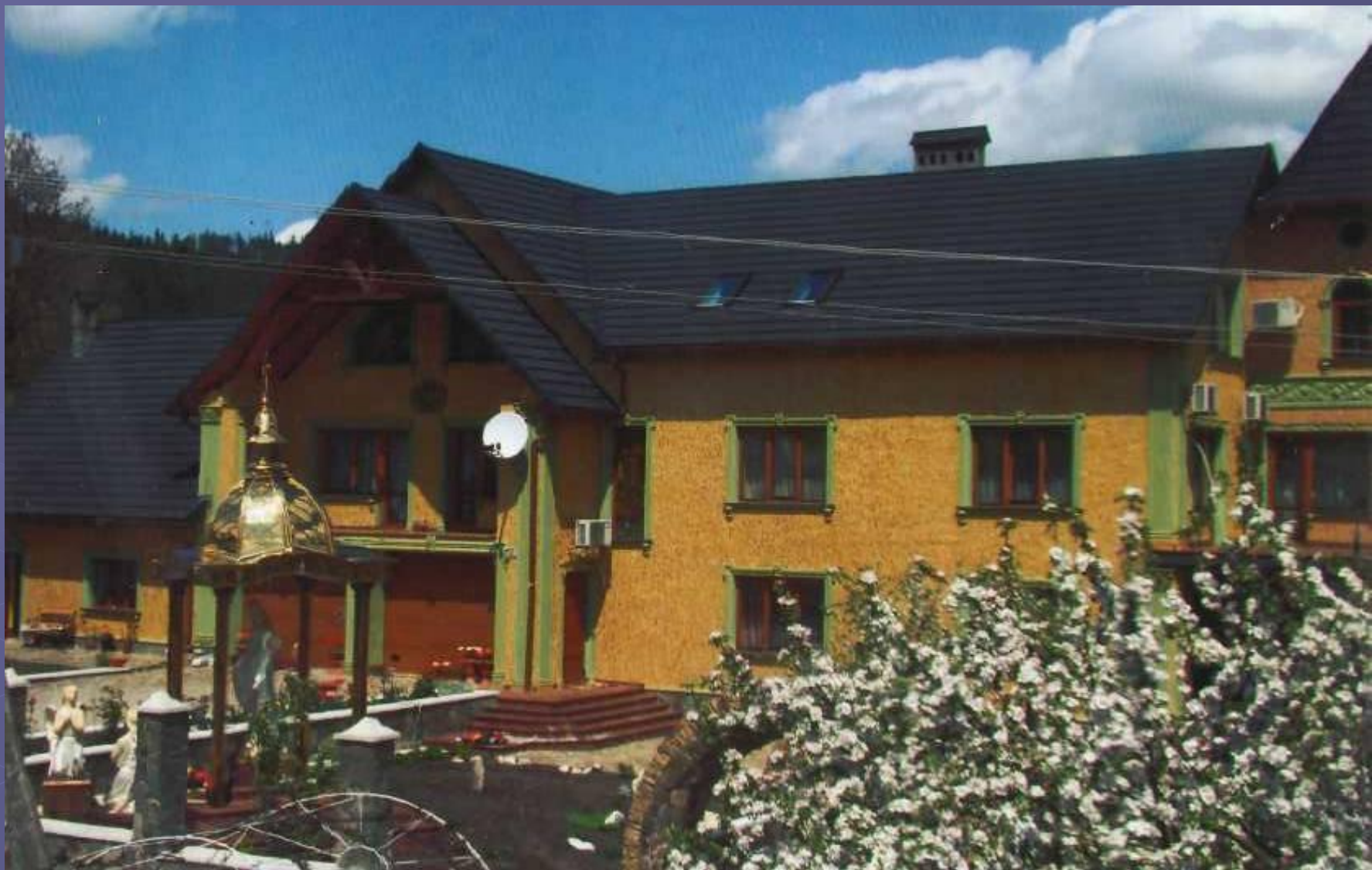
Багатоповерховий будинок поч. ХХІ ст. с. Лопушна. 2011р.