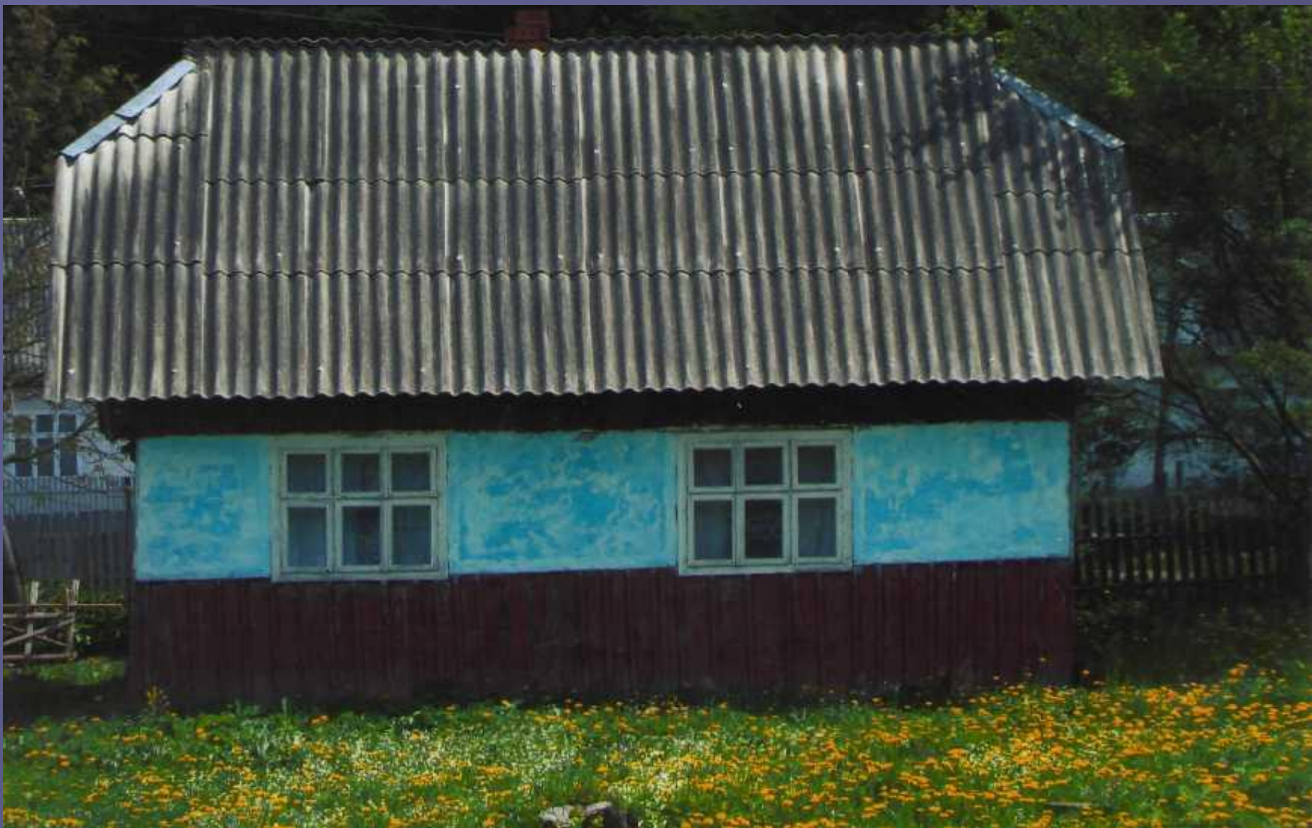
Хата 50-х років ХХ століття с. Лопушна