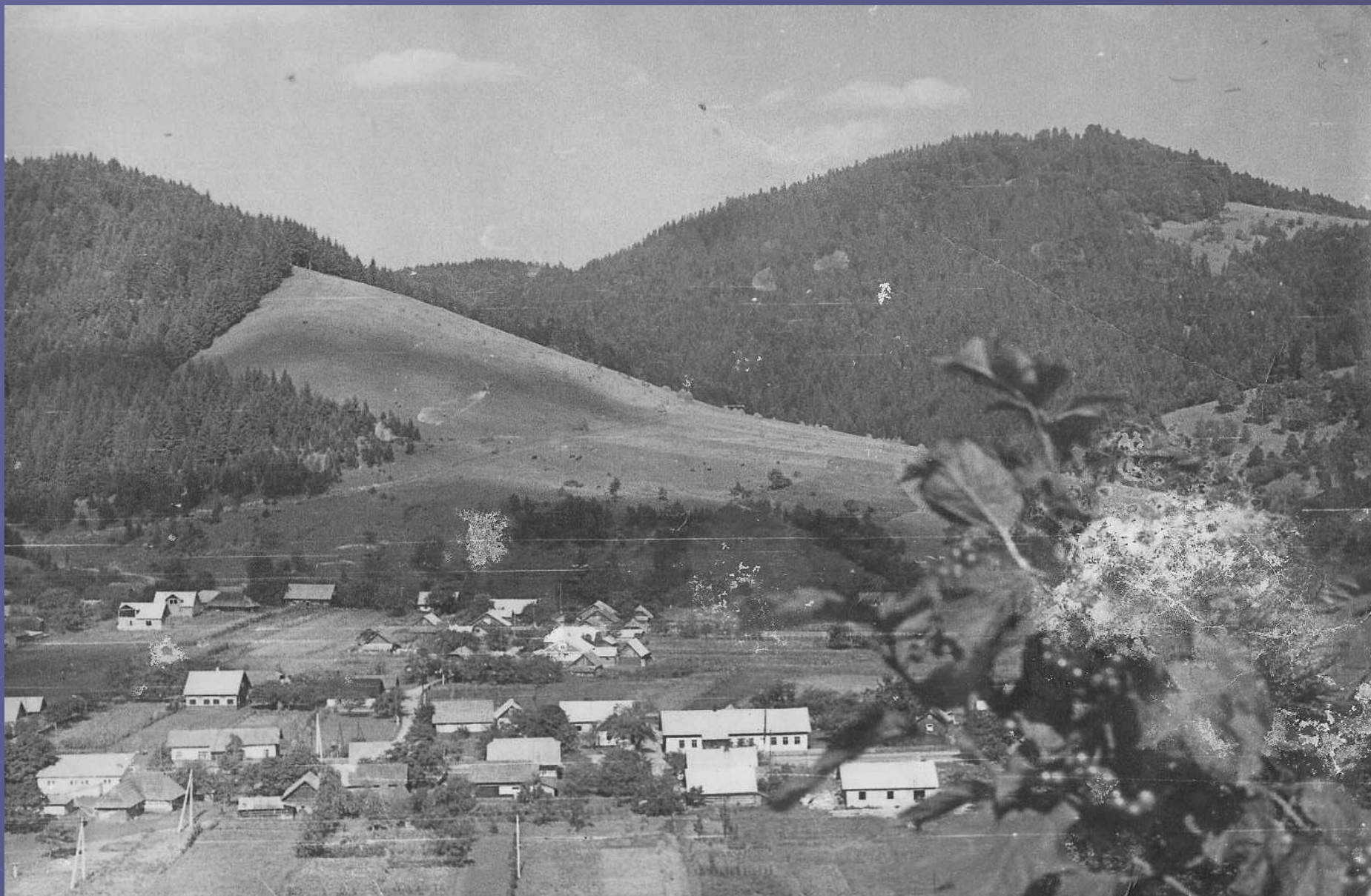
Село Лопушна 80 –х років ХХ ст.