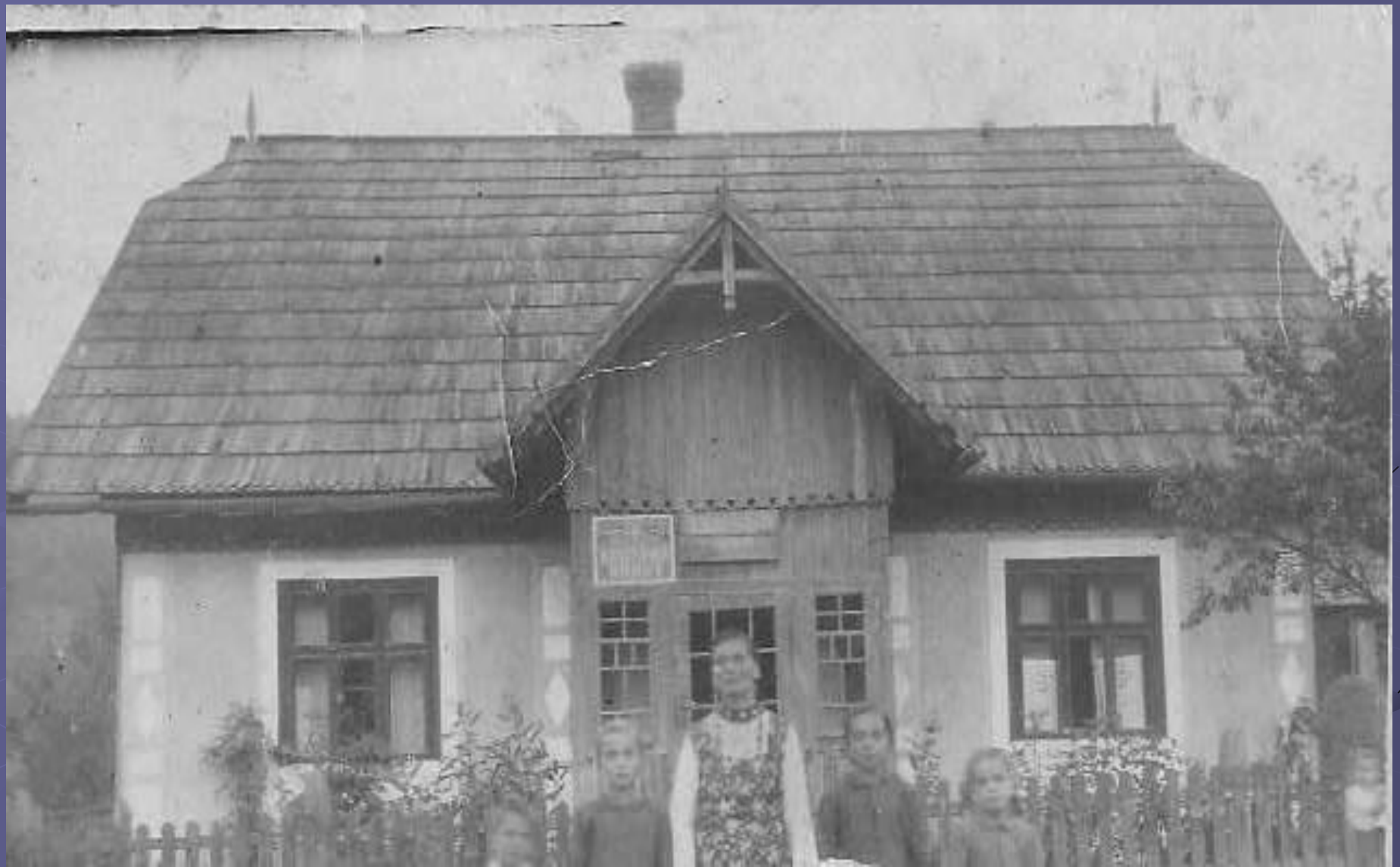
Аптечний пункт та половий будинок 50-х років ХХ століття