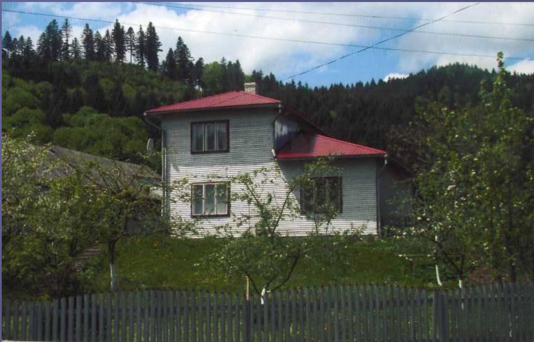
Багатокімнатний будинок 90-х років ХХ ст.. с. Лопушна