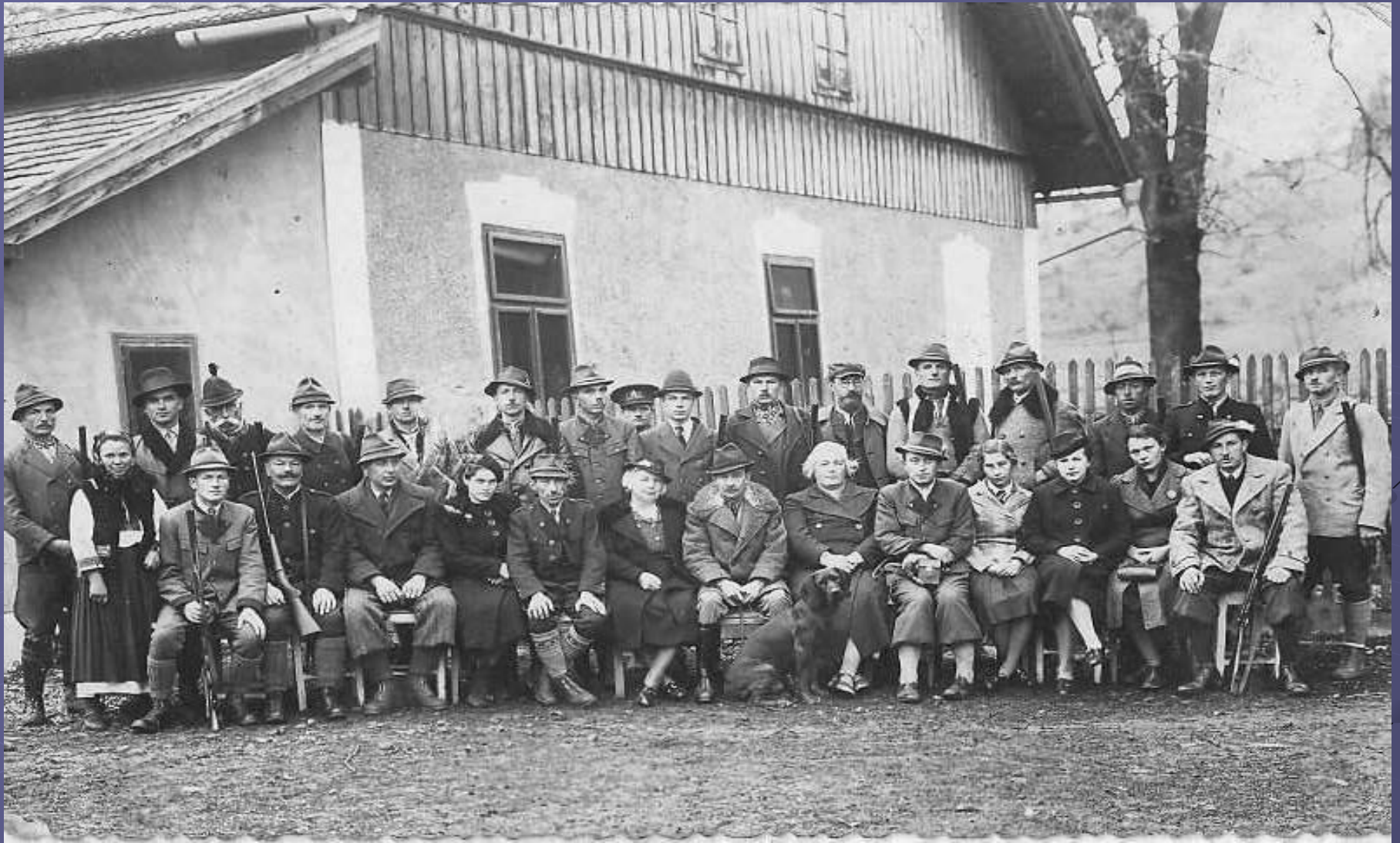
З'їзд мисливців Буковини 30-ті рр. ХХ ст. с. Лопушна