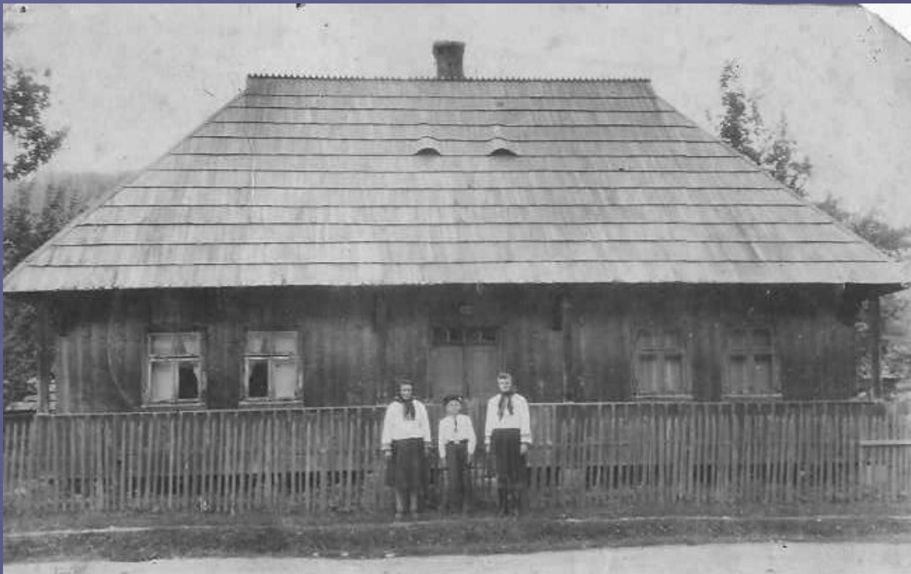
Чотирикамерна хата 20-х років ХХ ст. с Лопушна