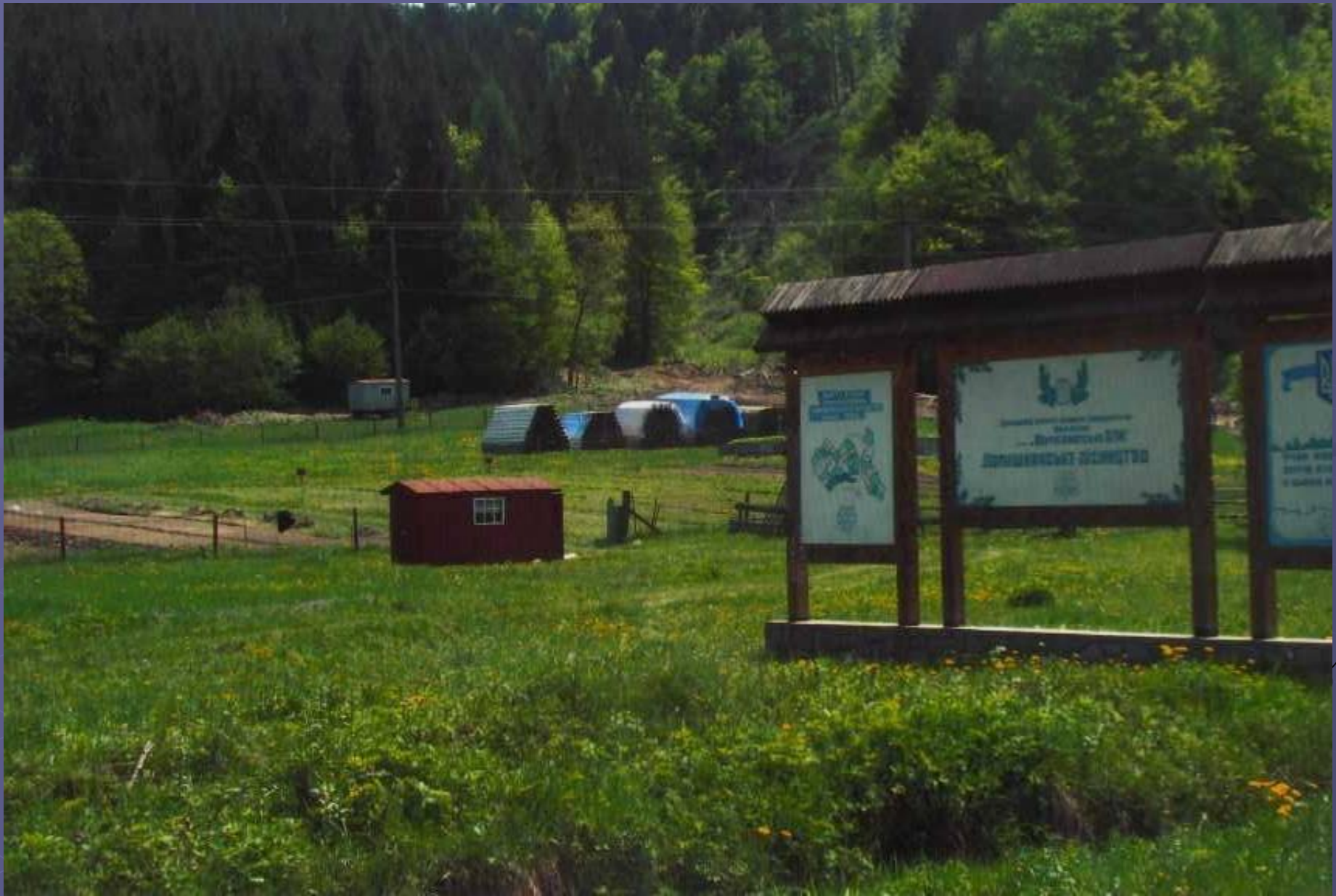
Розсадник с. Лопушна