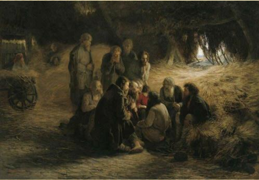
Г. Мясоєдов. Читання Положення 19 лютого 1861 року.