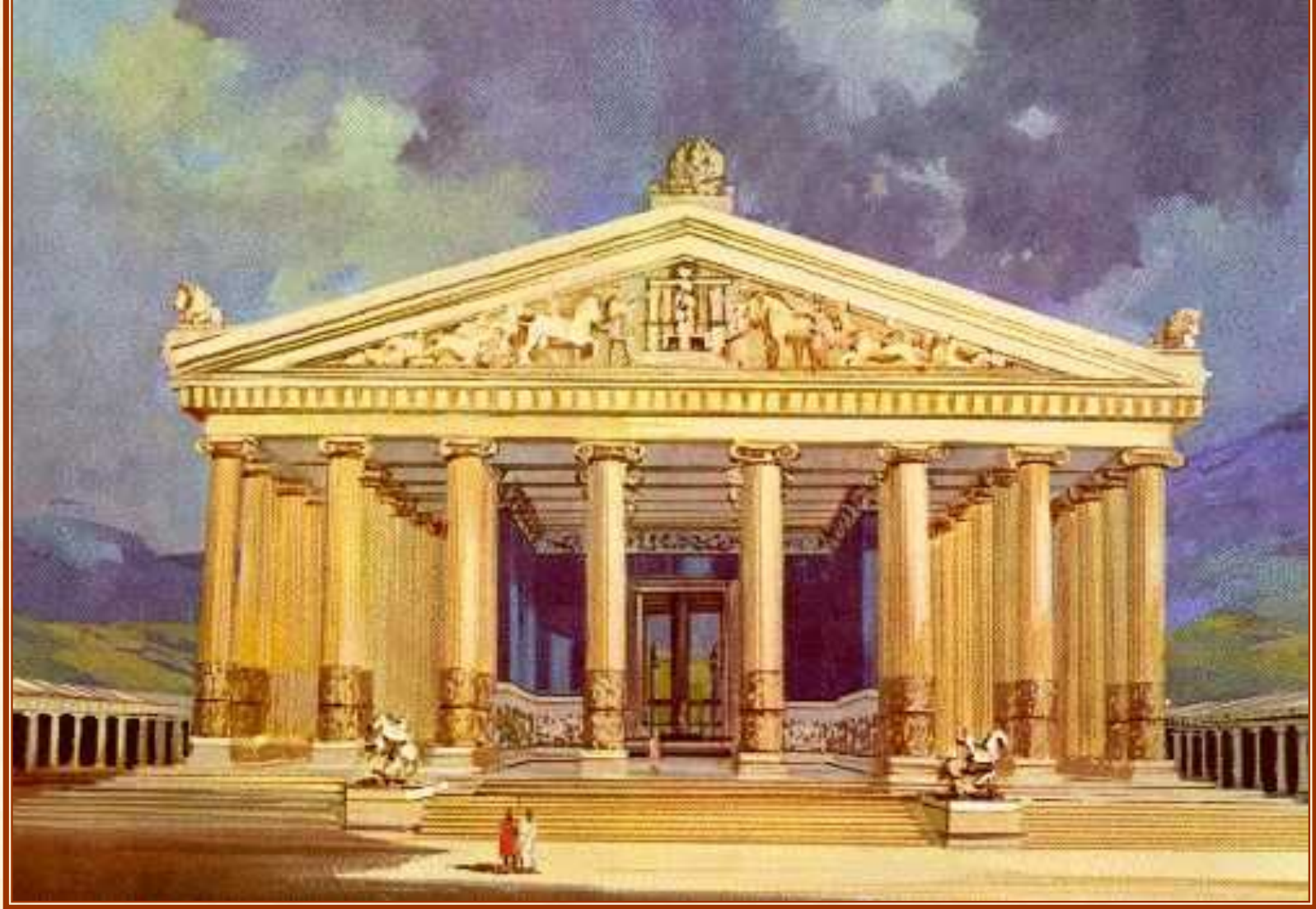
Храм Артемиды в Эфесе. Современный рисунок.