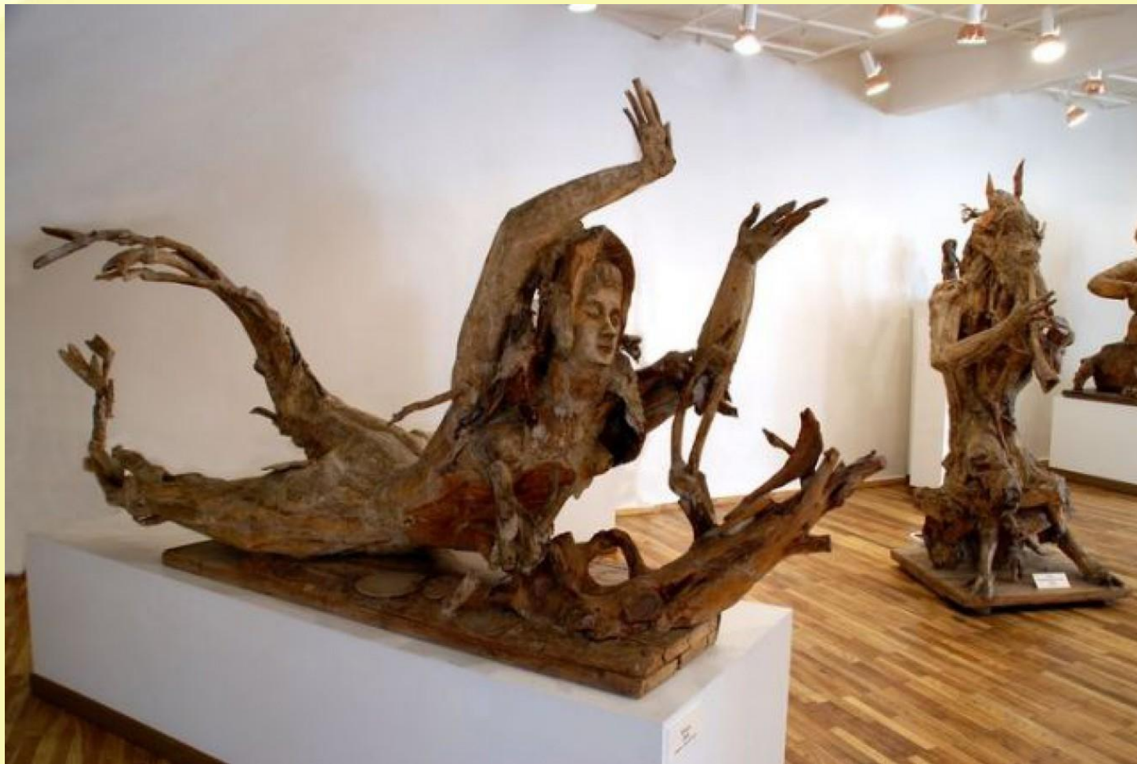
Музей скульптуры С.Т.Коненкова в Смоленске