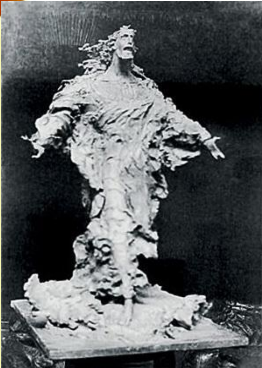
Христос, идущий по водам. 1935 г.