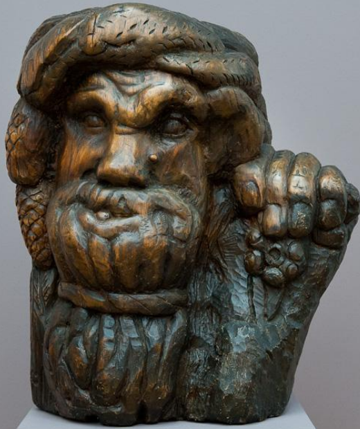
Лесник. 1909 дерево