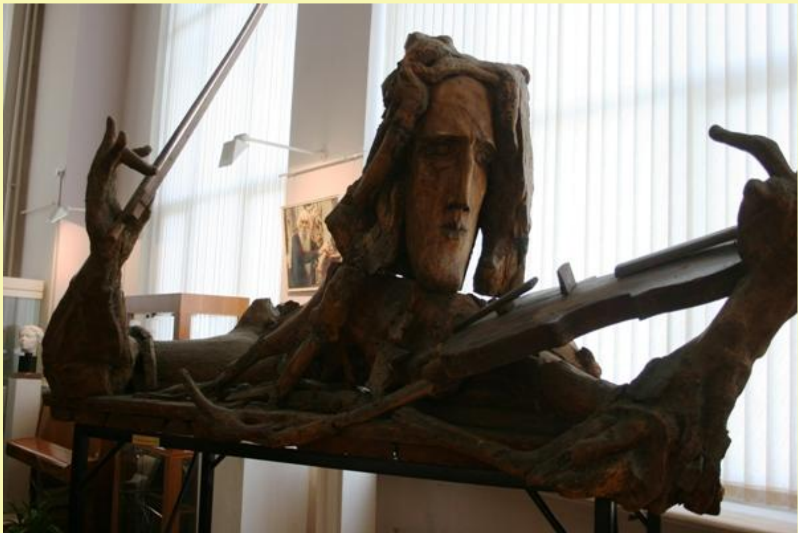
Сергей Коненков «Паганини» Дерево 1956