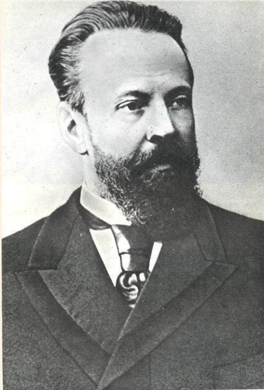
Сергей Юльевич Витте (1849-1915)