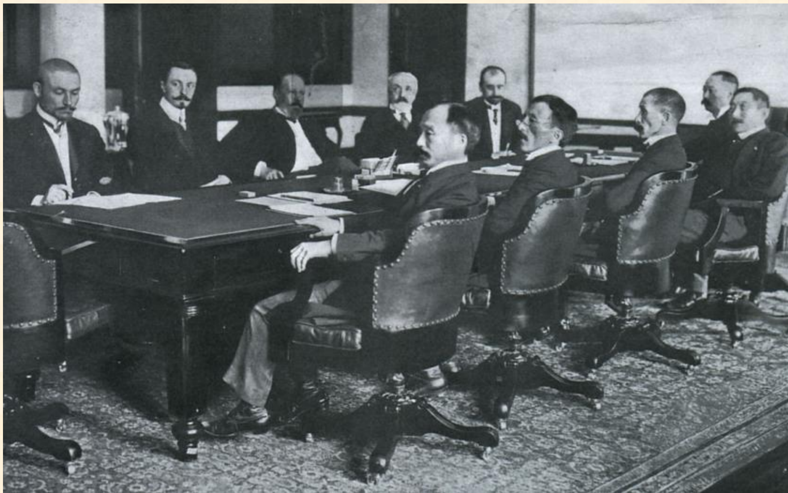
Русско-Японская война. Переговоры мира. 1905 год.