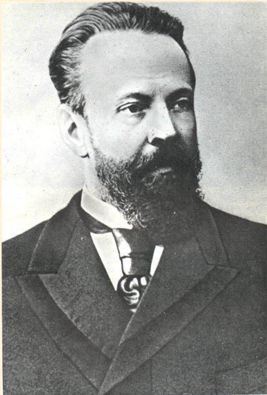
Сергей Юльевич Витте (1849-1915)