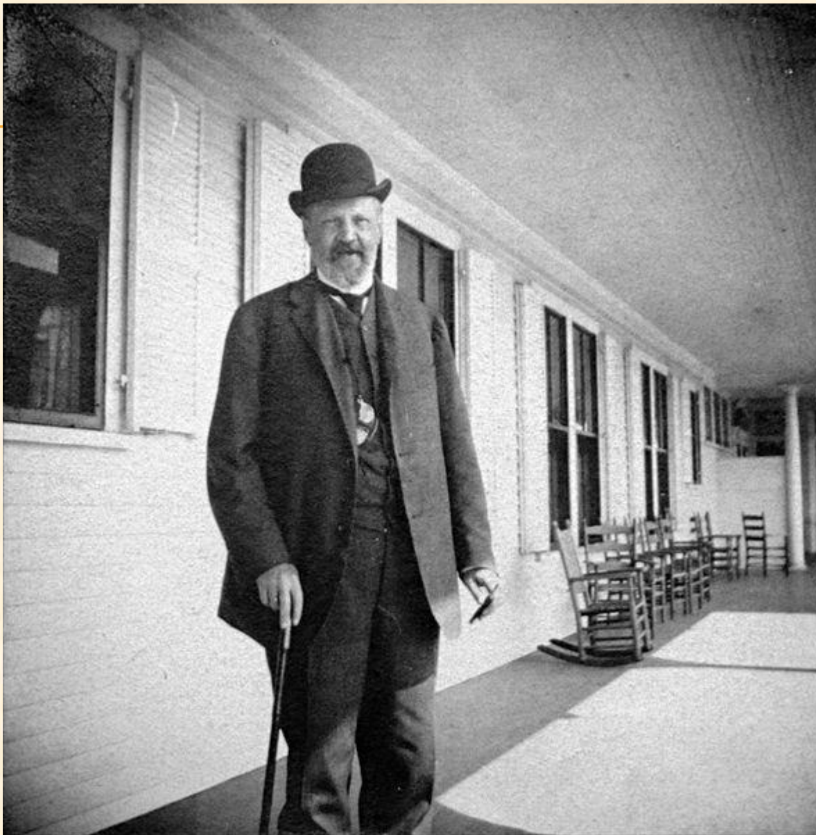
С. Ю. Витте на пароходе при путешествии в Америку