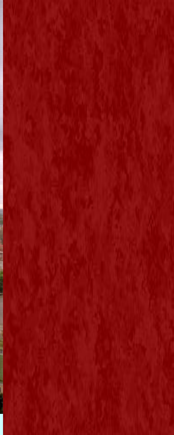
Крест на большом куполе Успенского собора Троице-