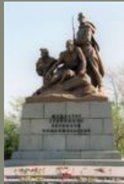
Памятник комсомольцам, погибшим в годы Великой Отечественной войны.