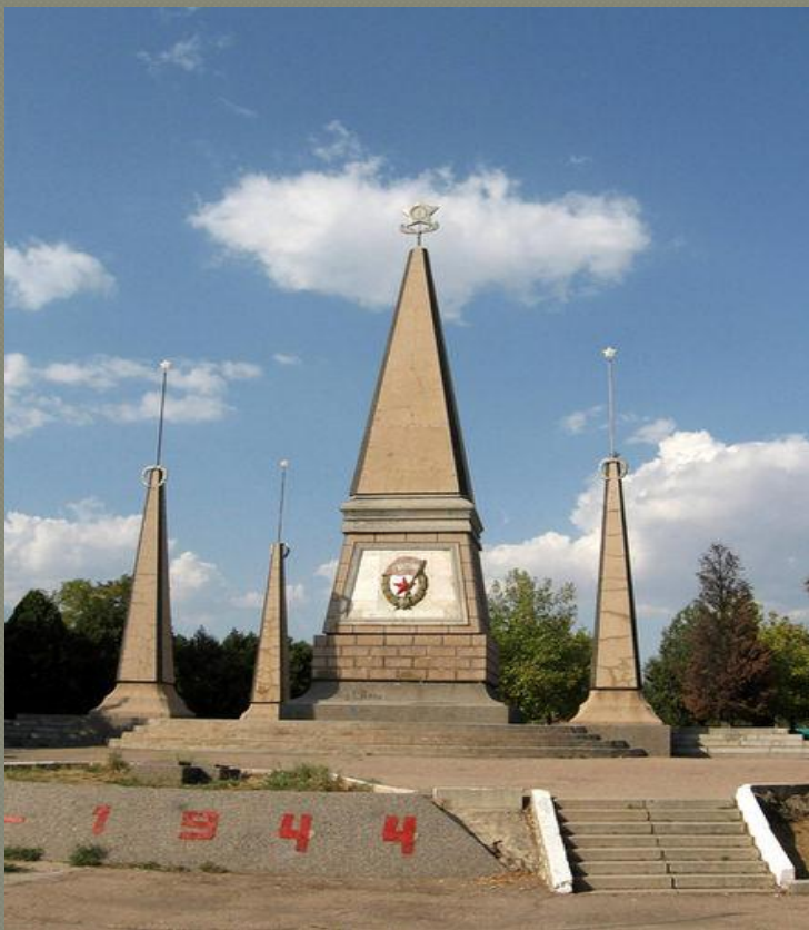
2 гвардейская армия