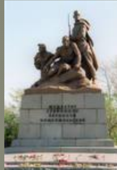
Памятник комсомольцам, погибшим в годы Великой Отечественной войны.