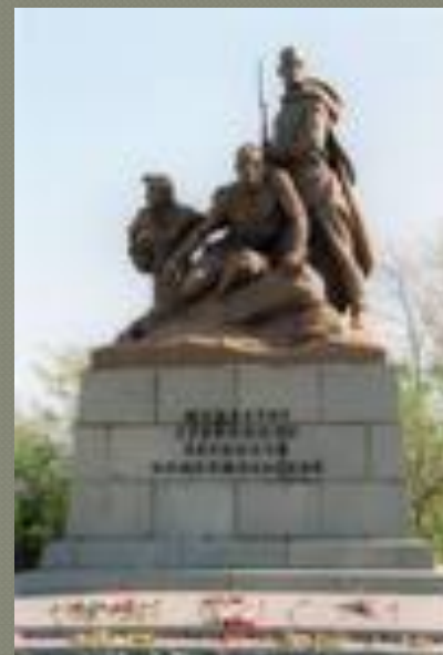
Памятник комсомольцам, погибшим в годы Великой Отечественной войны.