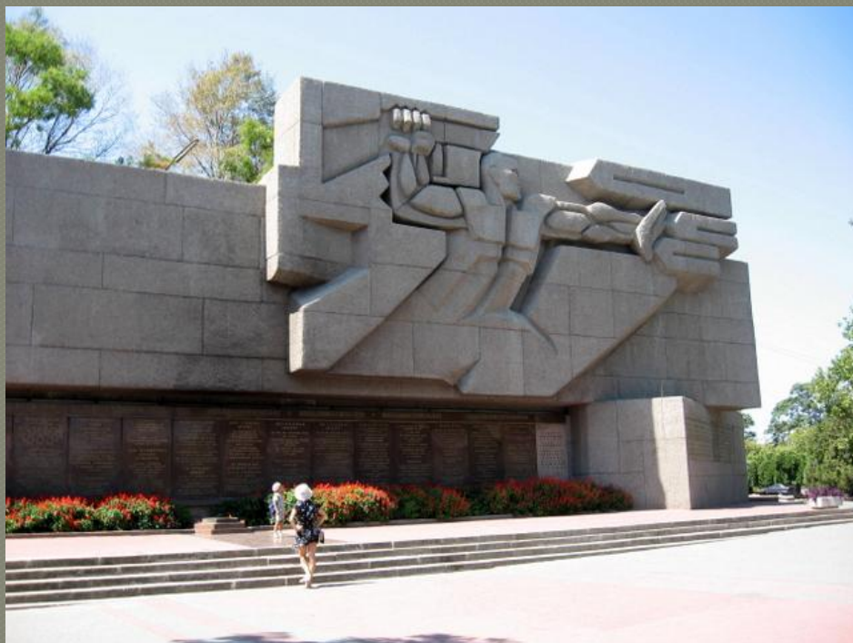
Монументальный памятник посвященный подвигу защитников Севастополя