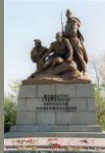
Памятник комсомольцам, погибшим в годы Великой Отечественной войны.