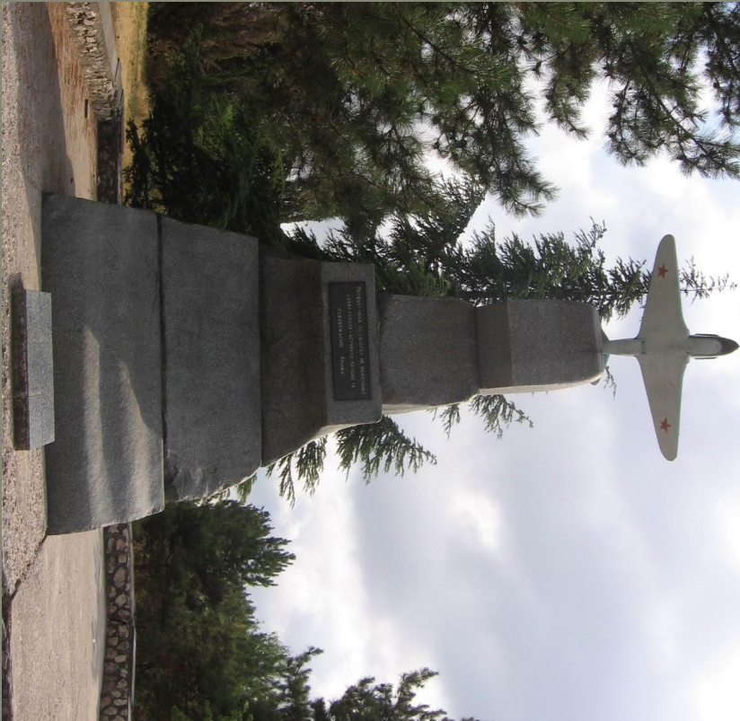
Памятник летчикам 8-й воздушной армии