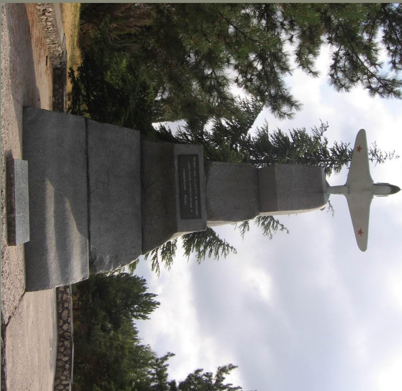
Памятник летчикам 8-й воздушной армии