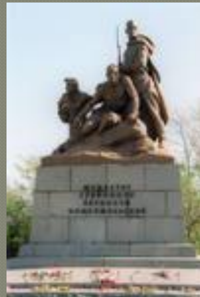
Памятник комсомольцам, погибшим в годы Великой Отечественной войны.