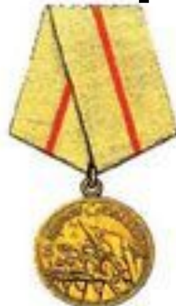
Медаль «За оборону Сталинграда»