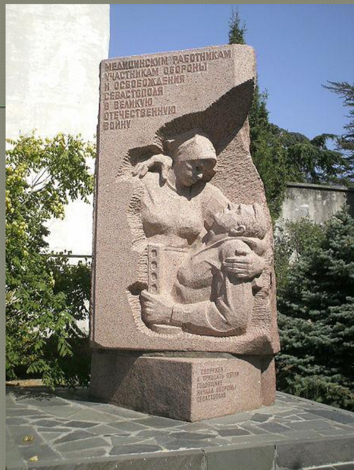
Медицинским работникам, участникам обороны и освобождения города