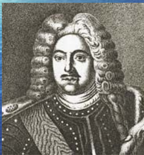
М. М. Голицын