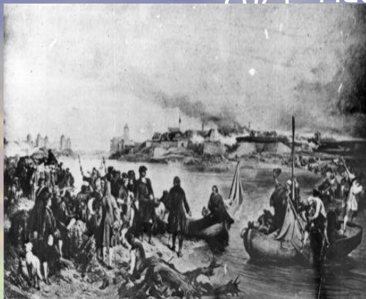
А.Е. Коцебу. Взятие Нарвы. 1704