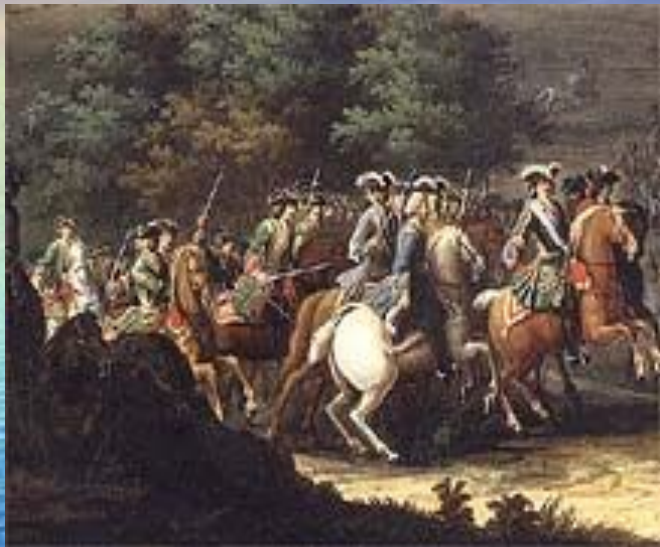
Ф.Симон «Полтавское сражение»