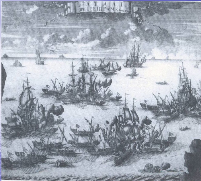
Битва при Гренгаме