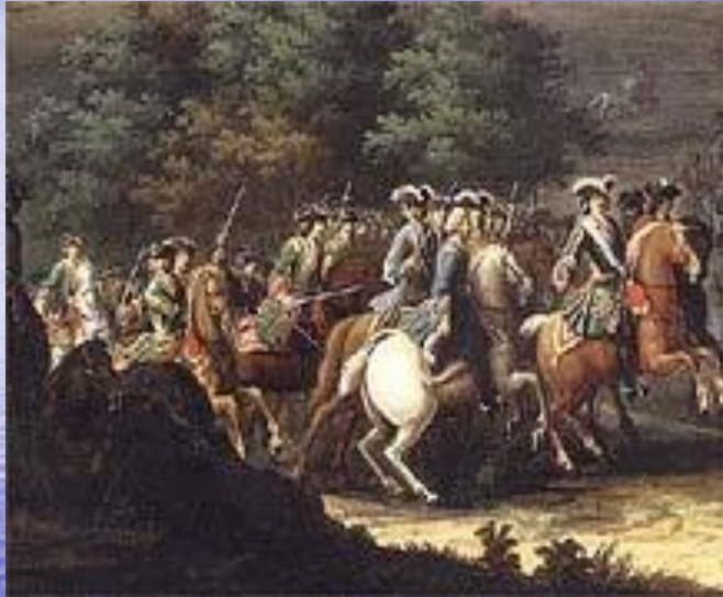
Ф.Симон «Полтавское сражение»

Полтавское сражение стало переломным моментом в Северной войне. После Полтавской победы русскую армию стали считать одной из сильнейших в Европе. Победа, одержанная под Полтавой, поставила Россию в ряд великих держав Европы. Отныне важнейшие вопросы европейской политики будут решаться с участием России.