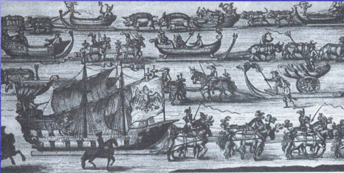
Маскарад в Москве в 1722 г. по случаю празднования Ништадтского мира