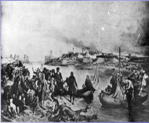
А.Е. Коцебу. Взятие Нарвы. 1704