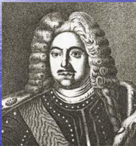
М. М. Голицын