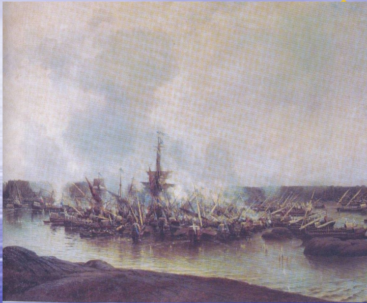
А. Боголюбов «Сражение при Гангуте»

Первый поход 1712 года удачи не принес, потому что был плохо подготовлен. Следующий поход повторился в 1713 году. 10 мая 1713 года русский галерный флот под командованием генерал-адмирала Ф.М.Апраксина подошел к крепости Гельсингфорс и начал бомбардировку. Вскоре город был взят.