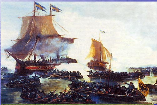
Взятие Петром Первым шведских кораблей в устье Невы. 1703