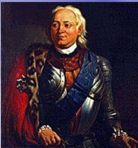
Ф. М. Апраксин.