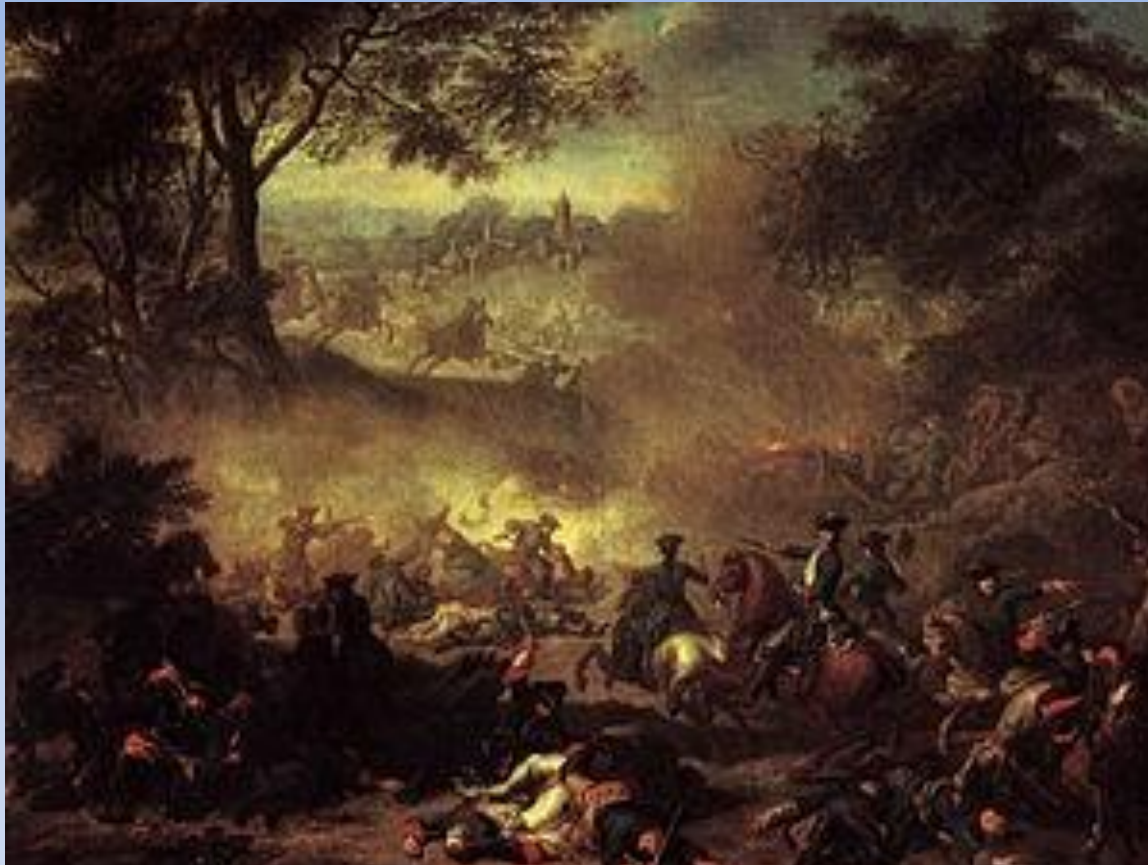
Битва у Лесной 1708