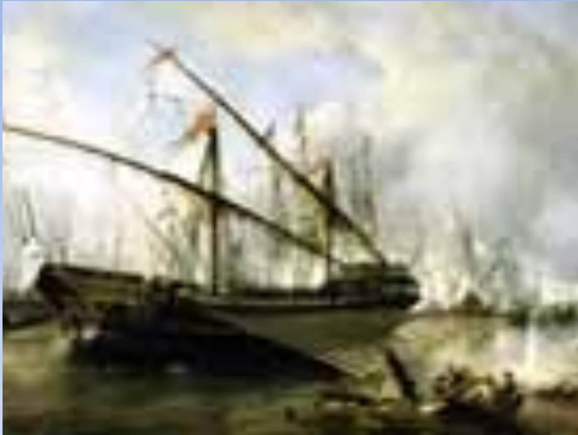
Сражение при Гренгаме – 1720г.