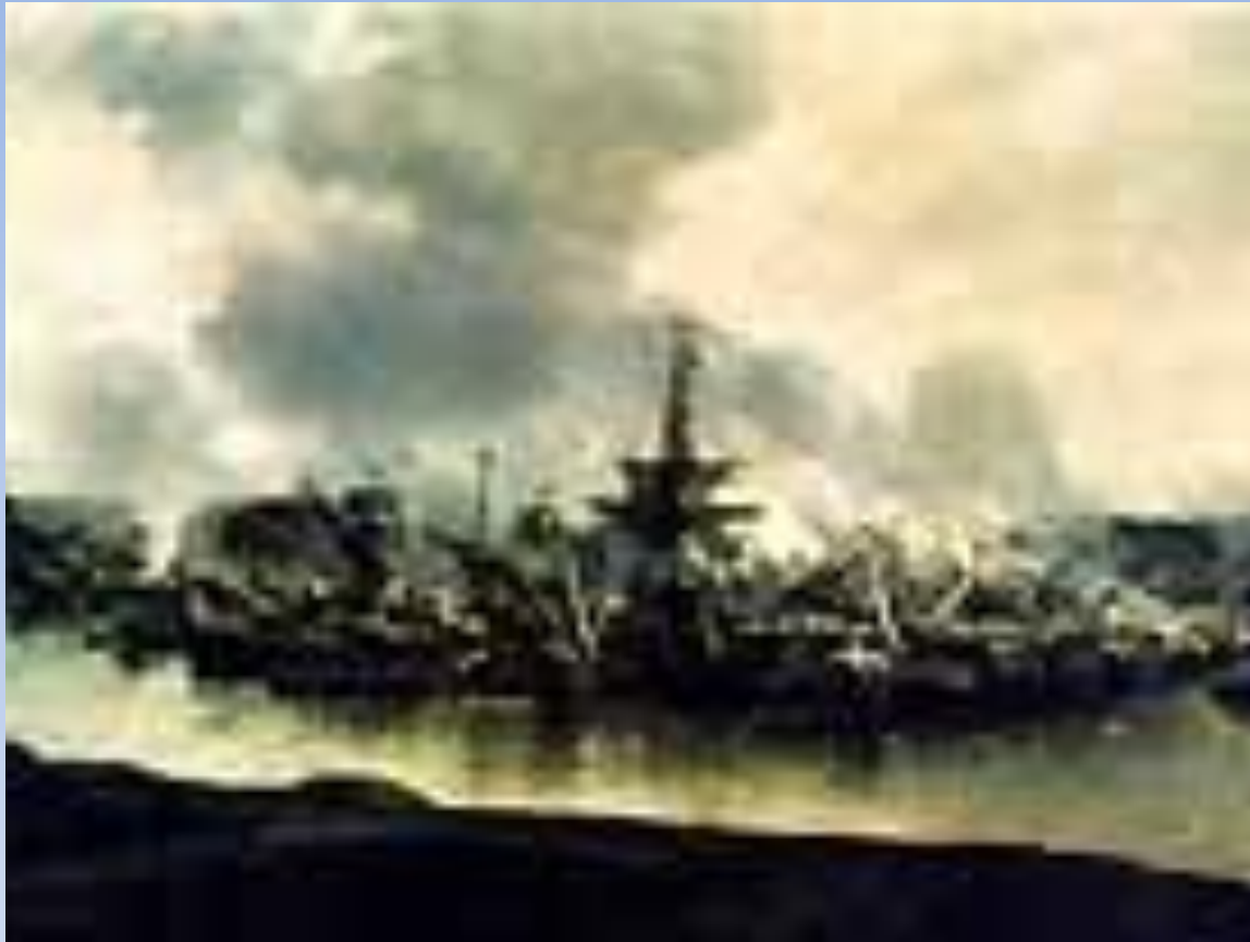
Сражение при Гангуте – 1714г\