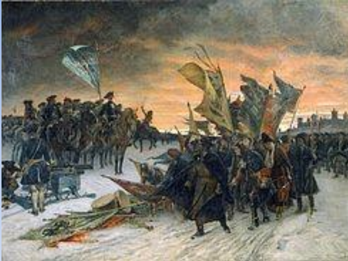
Нарвская конфузия 1700г.