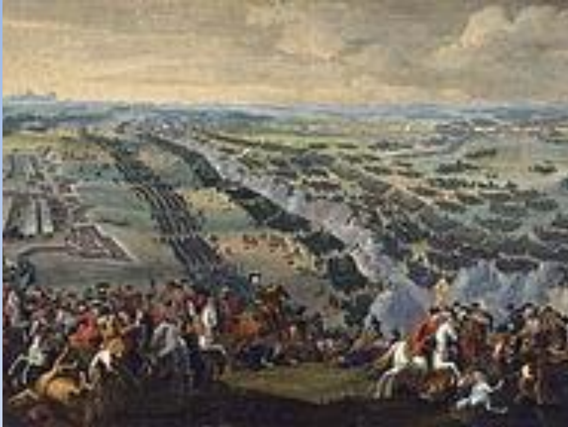
Полтавская битва 27 июня 1709г.