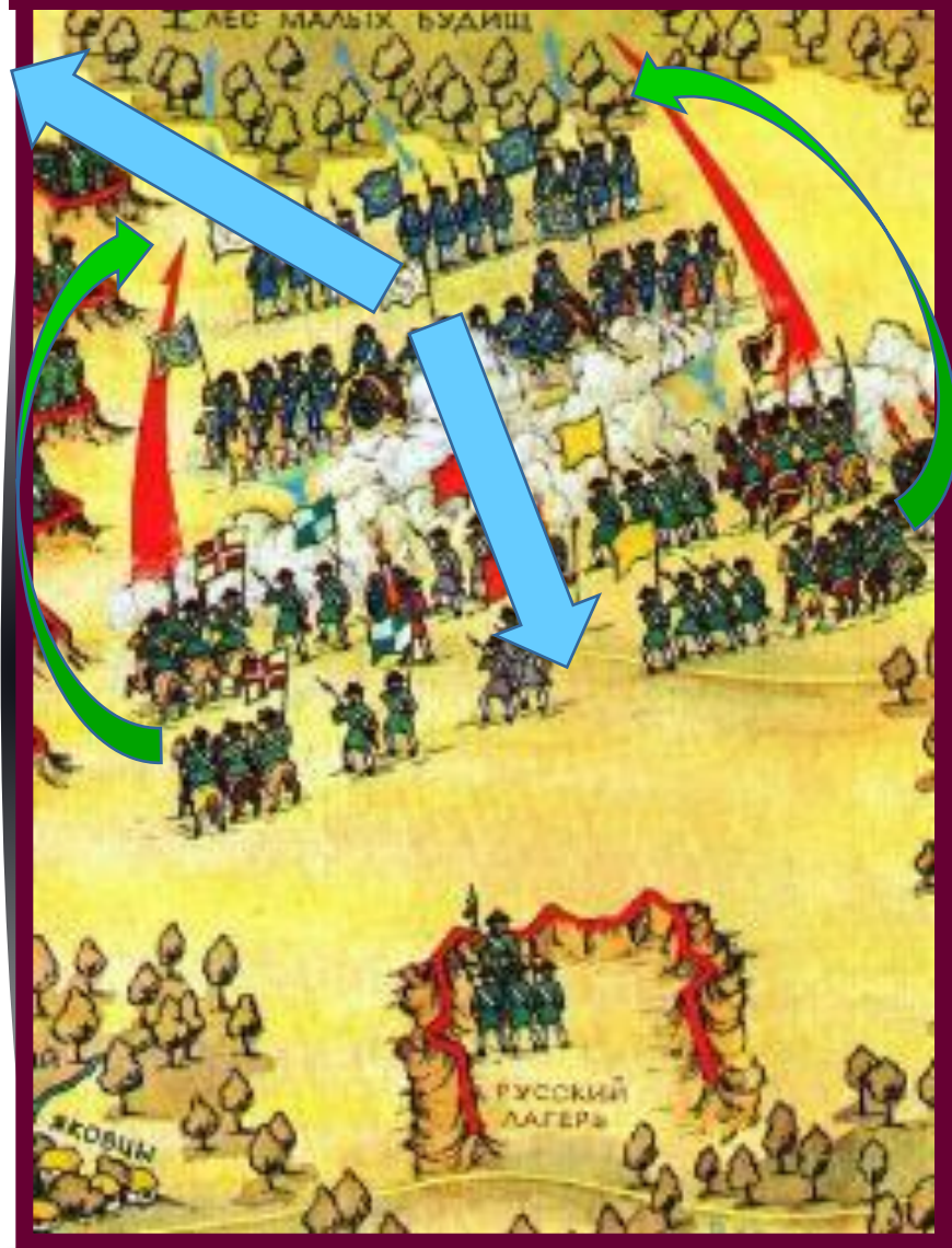
Этап Полтавской битвы.

В решающий момент, Петр взял Новгородский полк и нанес противнику удар на правом фланге.