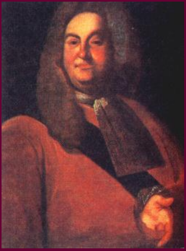
П.П.Шафиров.Глава русской делегации на переговорах с турками.

После Полтавы Россия овладела побережьем Балтики и Петр I решил сосредоточить внимание на черноморском побережье. В 1711 г. Турция, под давлением Карла XII объявила войну России.