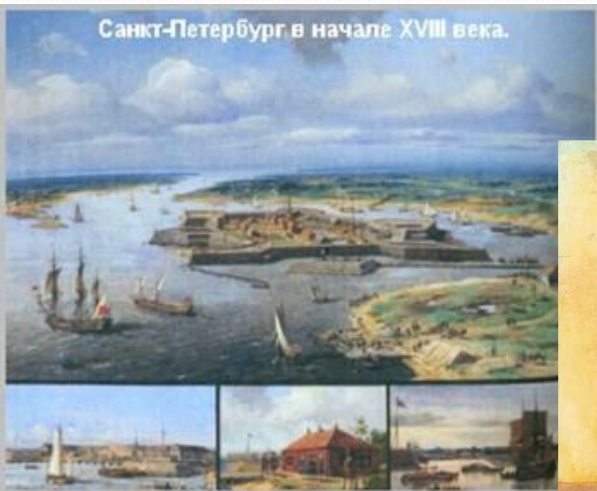
Санкт-Петербург в начале XVIII века.