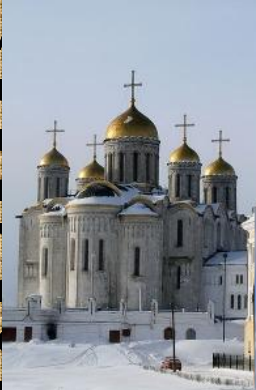
Перенес столицу в Суздаль. Успенский собор (1158-60 гг., перестроен 1158-60 гг.)

наследовал киевский престол. Тогда он вместе с братьями переехал в Ростов, а затем в Новгород. Опираясь на своих братьев, он укрепил Новгород, а затем перенес столицу в Суздаль.