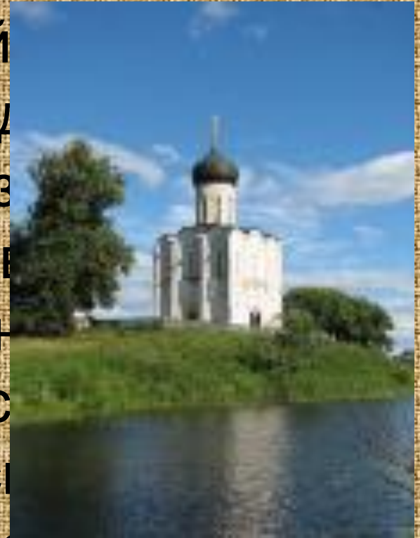
Вот Владимир Церковь Дровова на Нерли 1165г.