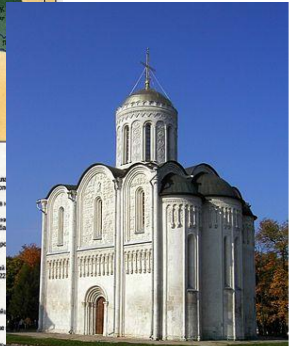
Дмитровский собор во Владимире. XII в.