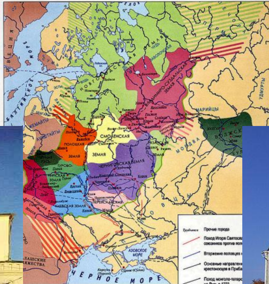
РАЗДРОБЛЕННОСТЬ РУСИ В 12 — 1-й ЧЕТВЕРТИ 13 в.