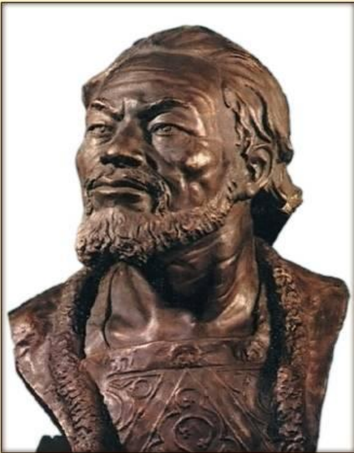
Скульптурный портрет, выполненный М.М. Герасимовым на основе черепа князя Андрея Боголюбского

Сын Юрия Владимировича Долгорукого. Наследовал Ростово-Суздальское княжение после смерти отца, в 1157 г.