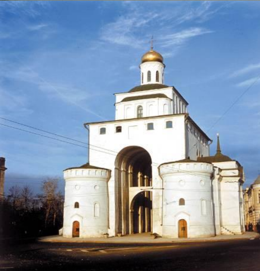
Золотые ворота во Владимире